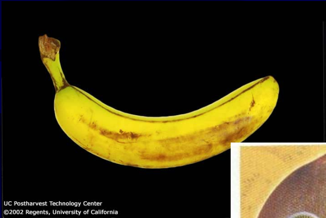
UC Postharvest Technology Center ©2002 Regents, University of California