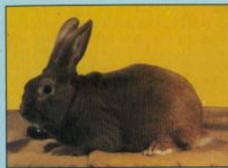
Εικ. 1.2.3. Η Πυρόξανθη Βουργουνδίας

Η φυλή αυτή στη συστηματική κονικλοτροφία χρησιμοποιείται συνήθως ως πατρικός πληθυσμός στις διασταυρώσεις με τις αμερικανικές φυλές Λευκής Νέας Ζηλανδίας και Καλιφόρνιας. Οι απόγονοι από τη διασταύρωση αρσενικού Πυρόξανθης Βουργουνδίας με θηλυκά Λευκής Νέας Ζηλανδίας ή Καλιφόρνιας έχουν ομοιόμορφους χρωματισμούς του άγριου κουνελιού και ειδικότερα: - αργυρόχρωμος - τεφρός (σταχτύς) από τη διασταύρωση με τη