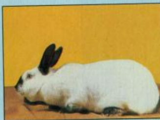
Εικ. 1.2.2. Η φυλή Καλιφόρνιας

Η φυλή της Καλιφόρνιας πολλαπλασιάζεται είτε αμιγώς, για την παραγωγή κουνελιών κρεατοπαραγωγής, είτε διασταυρώνεται με άλλες φυλές για την παραγωγή μιγάδων κουνελιών κρεατοπαραγωγής, λόγω της συμβολής της στο σχηματισμό καλύτερου σφάγιου στα κουνέλια της πρώτης γενεάς (καλύτερη ανάπτυξη της σφαικικής χώρας και των μηρών και βελτίωση της αναλογίας σάρκας προς οστά). Στις διασταυρώσεις αυτές η φυλή της Καλιφόρνιας χρησιμοποιείται είτε ως πατρικός πληθυσμός, όταν διασταυρώνεται με τη Λευκή Νέας Ζηλανδίας, είτε ως μητρικός πληθυσμός όταν διασταυρώνεται με άλλες φυλές (Πυρόξανθη Βουργουνδίας, Αργυρόχρωμη Καμπανίας κ.ά.).