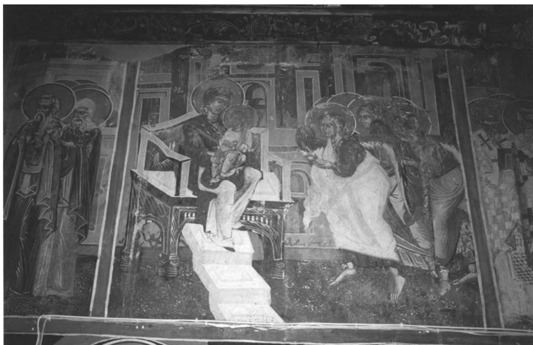
Εικ. 9. Ι.Μ.Βυτουμά. Καθολικό. Ακάθιστος Ύμνος, Οίκος Ξ'.