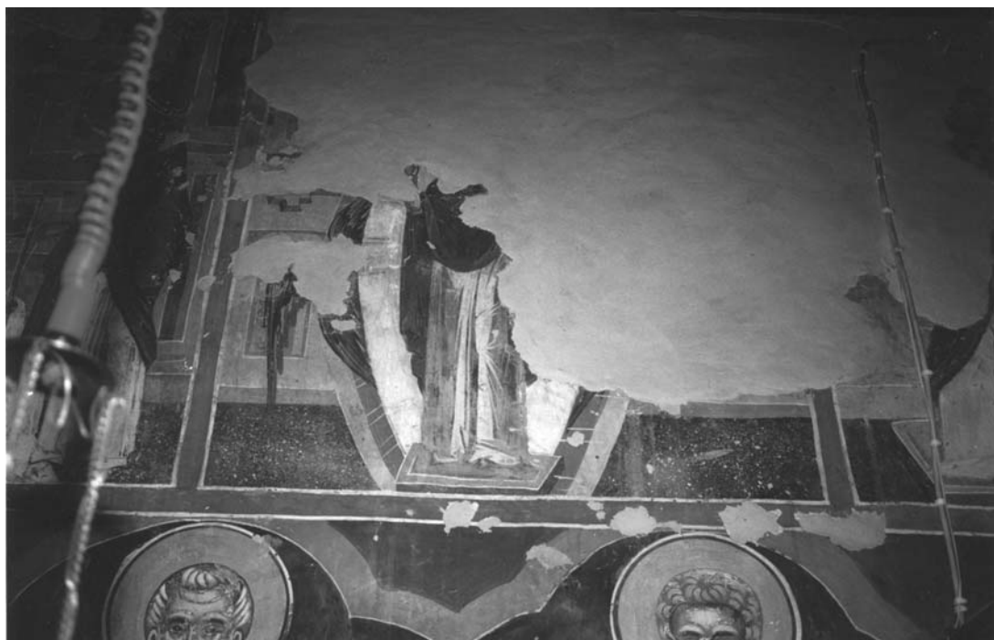
Εικ. 8. Ι.Μ.Βυτουμά. Καθολικό. Ακάθιστος Ύμνος. Οίκος Δ΄.