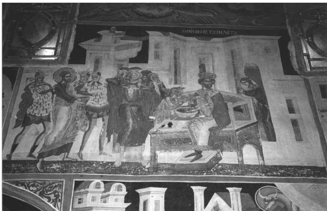
Εικ. 3. Ι.Μ.Βυτουμά. Καθολικό. Η Απόνιση του Πιλάτου.