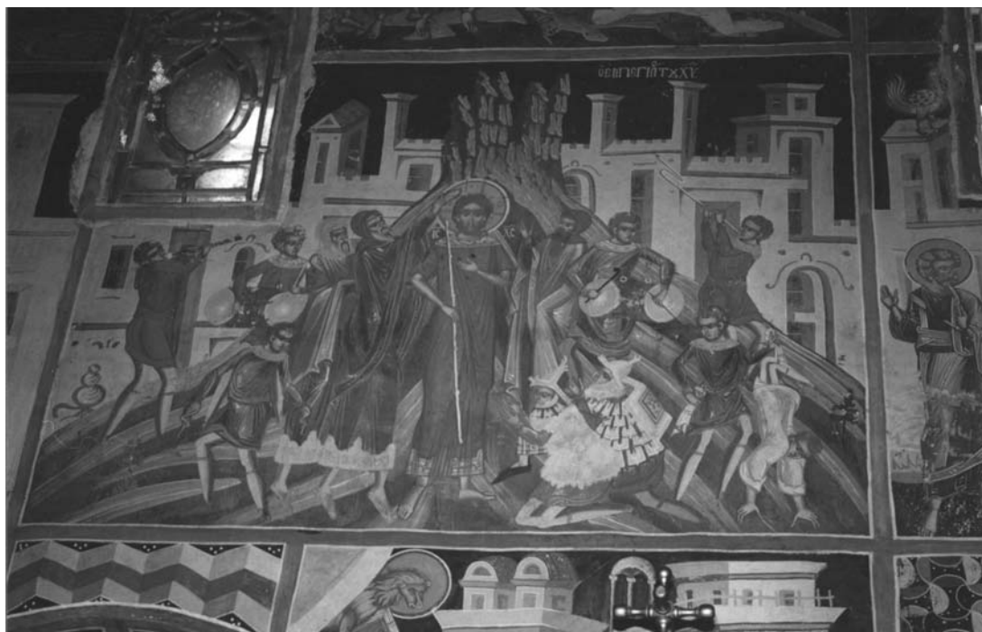
Εικ. 4. Ι.Μ.Βυτουμά. Καθολικό. Ο Εμπαιγμός.