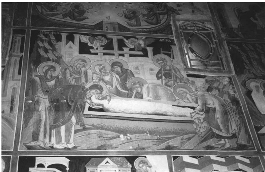
Εικ. 5. Ι.Μ.Βυτουμά. Καθολικό. Ο Επιτάφιος Θρήνος.