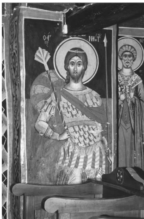
Εικ. 10. Ι.Μ.Βυτουμά. Καθολικό. Ο άγιος Νικήτας.