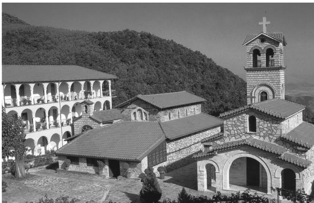
Εικ. 1. Ι.Μ.Βυτουμά. Καθολικό. Εξωτερική άποψη από νοτιοδυτικά.