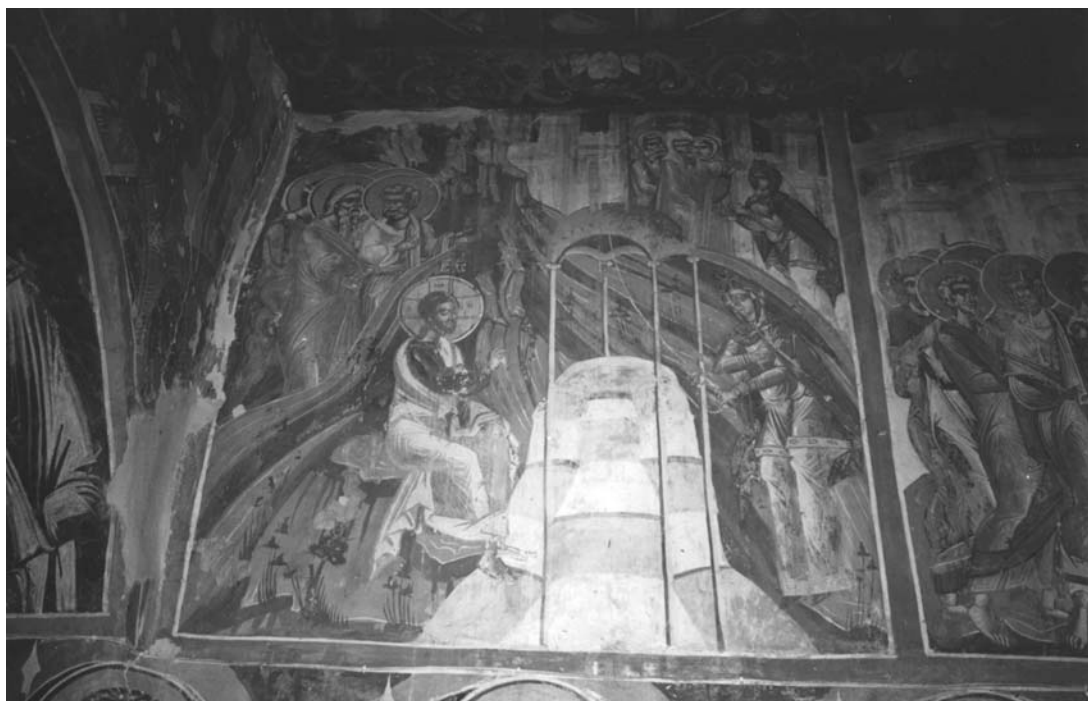
Εικ. 6. Ι.Μ.Βυτουμά. Καθολικό. Η Συνάντηση του Χριστού με τη Σαμαρείτιδα.