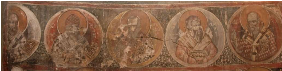
Εικ. 9 Άγιοι σε μετάλλια.