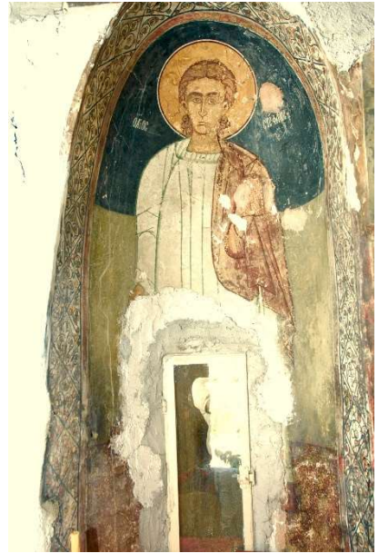
Εικ. 7 Ο Άγιος Στέφανος.