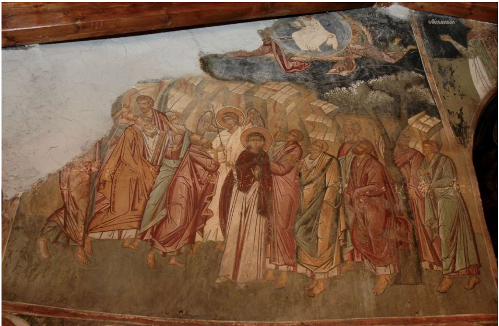
Εικ. 6 Η Ανάληψη του Χριστού.