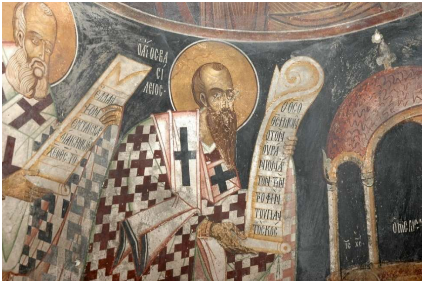
Εικ. 4 Κόγχη Ιερού. Άγιος Βασίλειος και άγιος Γρηγόριος ο Θεολόγος. Λεπτομέρεια.