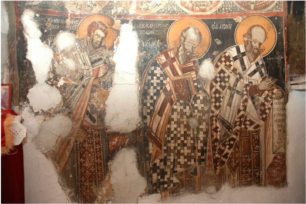
Εικ. 8 Οι άγιοι Διονύσιος ο Αρεοπαγίτης, Αχίλλιος Λαρίσης και Ελευθέριος Ιλλυρικού.