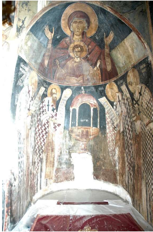
Εικ. 3 Κόγχη Ιερού.