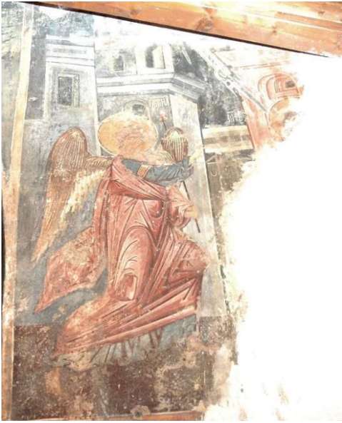
Εικ. 5 Ο Ευαγγελισμός της Θεοτόκου.