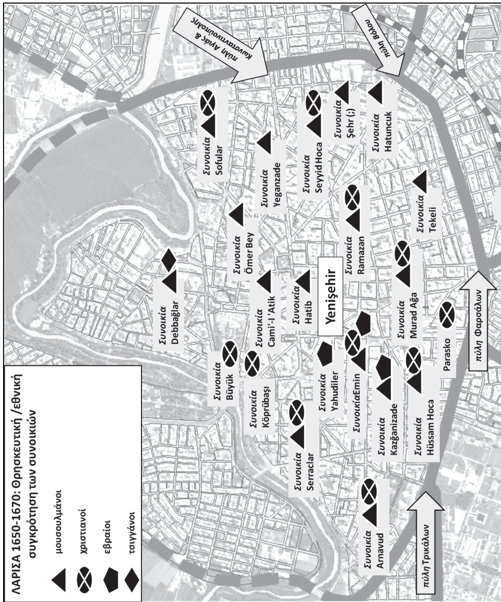
Χάρτης 2: Η εξέλιξη των συνοικιών στη Λάρισα (Yenişehir) στην περίοδο 1650-1670.