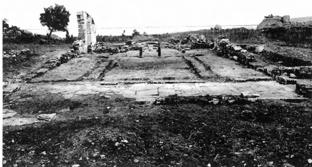
ΕΙΚΟΝΑ 1: Νικόπολη. Βασιλική Γ. Αποψη από τα Δυτικά (Φωτογραφικά Αρχεία Μουσείου Μπενάκη, αρ. αρν. P.181.67)