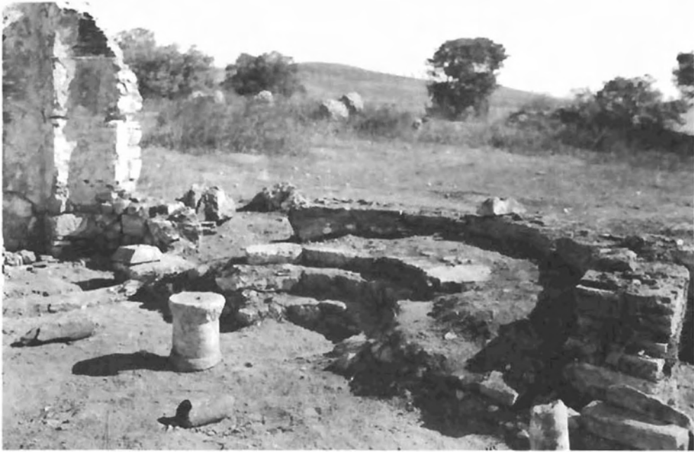
ΕΙΚΟΝΑ 2: Βασιλική Γ. Το ανατολικό τμήμα του ναού (Φωτογραφικά Αρχεία Μουσείου Μπενάκη, αρ. αρν. Ρ.181.68)