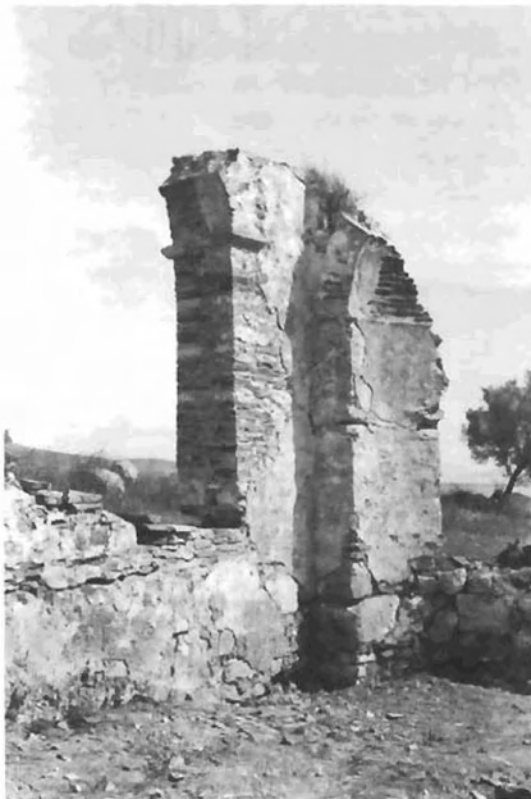
ΕΙΚΟΝΑ 3: Βασιλική Γ. Το ανατολικό τμήμα του βόρειου κλίτους