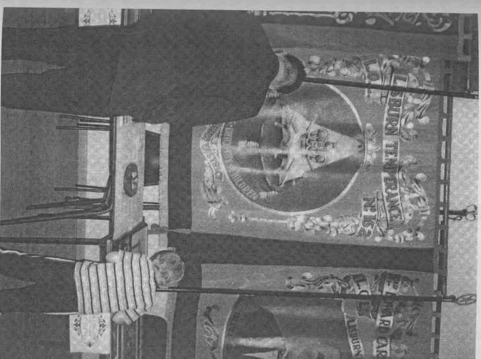
Εικόνα 11.2 Εκθεση της κοινότητας του Λισμπορν της Βόρειας Ιρλανδίας, Ιούλιος 2003. Η έκθεση πλαισιώνει την πολιτισμική Εβδομάδα Οραντζό.

Τα παραδείγματα του Μουσείου της Περιοχής Ήξι στο Κέιπ Τάουν, του δικτύου Κοινωτικών Μουσείων στο Μεξικό και των πρωτοβουλιών στη Βόρεια Ιρλανδία και ταδεικνύουν την αξία των καινούργιων μορφών μουσείου και μουσειακής πρακτικής οι οποίες αναπτύσσονται σε διάφορες κοινότητες. Όλα αυτά τα μουσεία περιγράφονται ως δυναμικοί οργανισμοί, οι οποίοι παρέχουν στους κατοίκους των αντίστοιχων περιοχών μια αναανεωμένη, θετική αντίληψη της ταυτότητάς τους, ενισχύοντας