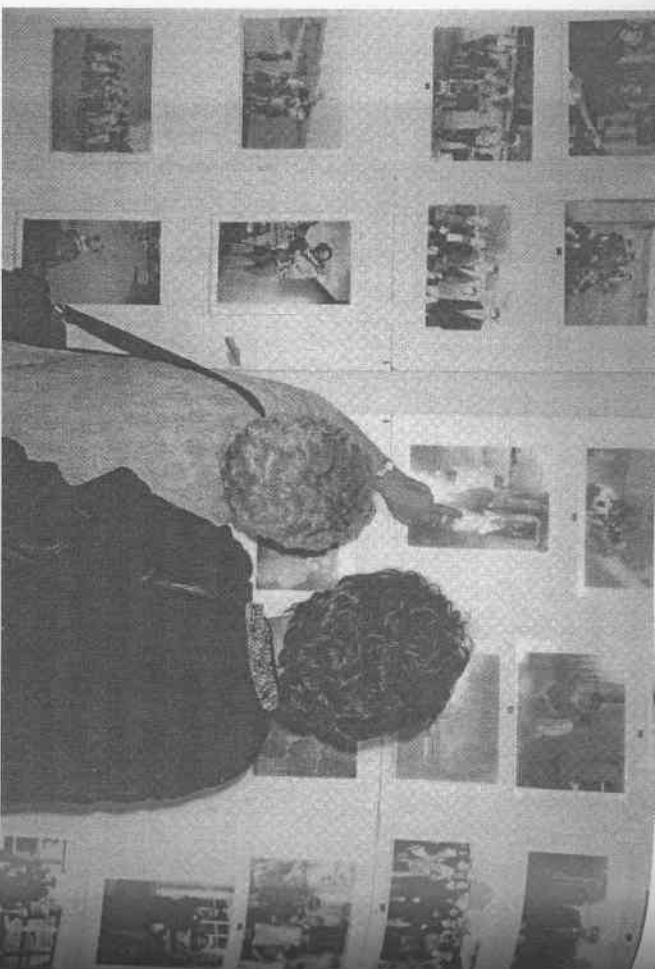
Εικόνα 11.1 Εκθεση της κοινότητας του Νισούρ της Βόρειας Ιρλανδίας, Ιούλιος 2003. Η έκθεση διοργανώθηκε από την επιτροπή πολιτισμικής κληρονομιάς κάποιου οργανισμού κοινότητας ανάπτυξης.

Χαρακτηριστικά παραδείγματα εκθέσεων αυτού του είδους αποτελούν εκείνες που οργανώθηκαν από το Ulster People's College, στο Μπέλφαστ, μέσω της Πρωτοβουλίας Ιστορίας των Ανθρώπων. Χάρη στην εν λόγω πρωτοβουλία, η οποία ξεκίνησε το 2001, περίπου δεκαπέντε ομάδες οργάνωσαν εκθέσεις βρασιγμένες στην τοπία της κοινότητάς τους (Crooke 2005). Στο σύνολο των περιπτώσεων αυτών, οι εκθέσεις αποτελούσαν ασκήσεις κοινωτικής «αυτοβιογραφίας»: η κοινότητα έκανε μία διαλογή μεταξύ των ιστοριών της, επέλεγε τα αντικείμενα και τις εικόνες που θα επέθετε και προσέφερε τη δική της ερμηνεία αναφορικά με γεγονότα και εμπειρίες του παρελθόντος. Για τις ομάδες, η επιτυχία βραζιόταν στη συνεισοφορά της συλλογικής εργασίας στη διαμορφωση, τη συνοχή και την ενόχληση της κοινωτικής ταυτότητας. Κάθε στάδιο έχει αξία και αποτελεί αναπόσπαστο κομμάτι μιας διαδικασίας, εφόσον η ομάδα ωφελείται από τη διερεύνηση πιθανών θεμάτων, τη συλλογή ιστοριών και την επεξεργασία του υλικού, καθώς και από την όλη οργάνωση της έκθεσης και το γεγονός ότι τη μοιράζεται με άλλους ανθρώπους. Η μικρή διάρκεια των εκθέσεων και η συνεργασία καταξιωμένων ειδικών δεν αποδυναμώνουν τον αντίκτυπό τους. Ανεξάντλια, η έκθεση προοιαιμβάνει αξία ως μέρος μιας διαδικασίας, δεν αποτελεί