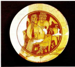
5. Πινάκιο με αδρεγάρρακτη διακόσμηση: αφαιρετική απεικόνιση στρατιώτη με λόβρο, τελευταίο τέταρτο 12ου αι. Μεσαιωνικό Μουσείο Κύπρου.