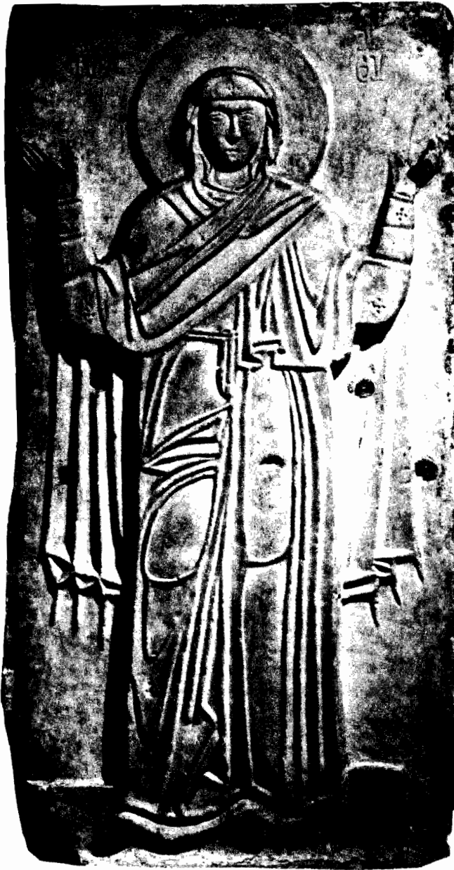
Εικ. 1. Μαρμάρινη εικόνα αγίας Θεοδώρας, 893, Βυζαντινό Μουσείο Ἀθηνῶν.