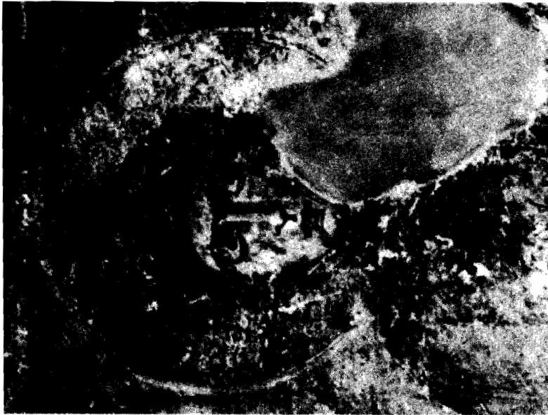
Εικ. 2. Ἡ ἅγια Θεοδώρα Θεσσαλονίκης. Τοιχογραφία στὸ προστῶο τῆς Ἁγ. Σοφίας Θεσσαλονίκης. Μέσα 11ου αἰ.