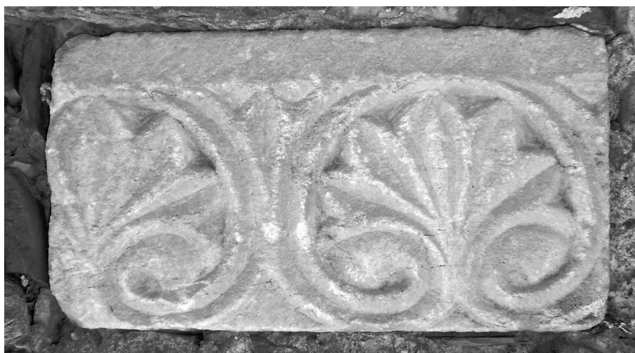
Εικ. 149 Άνω Βόλος, ναός Επισκοπής, εντοιχισμένο στον βόρειο τοίχο τμήμα κοσμήτη (Ι. Δ. Βαραλής)