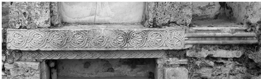
Εικ. 147 Άνω Βόλος, ναός Επισκοπής, εντοιχισμένος πεσσίσκος με συμφυή κιονίσκο στη δεξαμενή της βόρειας πλευράς του ναού (Ι. Δ. Βαραλής)