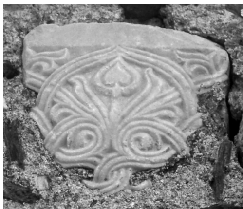
Εικ. 148 Άνω Βόλος, ναός Επισκοπής, εντοιχισμένο στον βόρειο τοίχο κιονόκρανο μικρών διαστάσεων (Ι. Δ. Βαραλής)