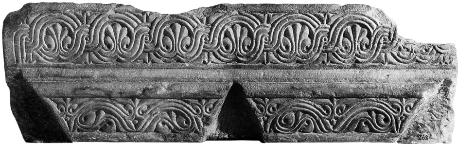
Εικ. 141 Βυζαντινό και Χριστιανικό Μουσείο Αθηνών, υπέρθυρο από τη Συλλογή Θησειού (πηγή: Μ. Σκλάβου-Μαυροειδή, Γλυπτά του Βυζαντινού Μουσείου Αθηνών: Κατάλογος, Αθήνα 1999, 172, αρ. 237)