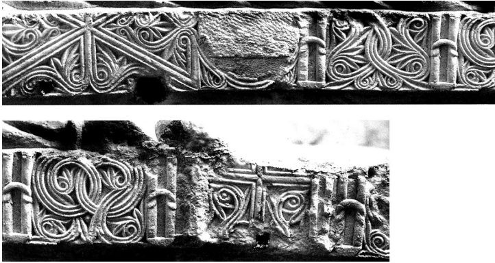
Εικ. 140 Ταξίαρχης Μεσαριάς, επιστύλιο τέμπλου