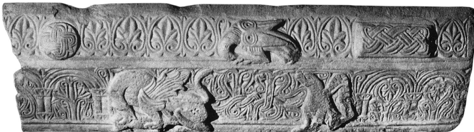
Εικ. 142 Ταξίαρχης Μελίδας, επιστύλιο τέμπλου πρόθεσης (πηγή: Χ. Μπούρας – Λ. Μπούρα, 'Η έλλαδική ναοδομία κατά τον 12ο αιώνα, Αθήνα 2002, 75, εικ. 60γ)