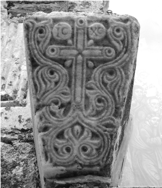
Εικ. 146 Άνω Βόλος, ναός Επισκοπής, εντοιχισμένο στον βόρειο τοίχο επίθημα αμφικιονίσκου (Ι. Δ. Βαραλής)