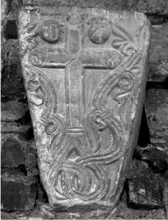
Εικ. 145 Μακρινίτσα, ναός Κοίμησης της Θεοτόκου, εντοιχισμένο στον δυτικό τοίχο επίθημα αμφικιονίσκου (Ι. Δ. Βαραλής)