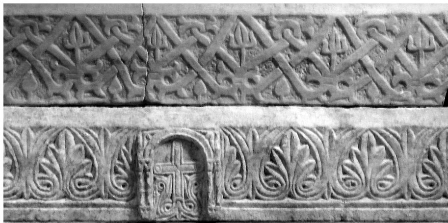
Εικ. 144 Βυζαντινό Μουσείο Υπάτης, τέμπλο της πρόθεσης από τον ναό του Ταξιάρχου στον Έξαρχο Φθιώτιδας (Ι. Δ. Βαραλής)