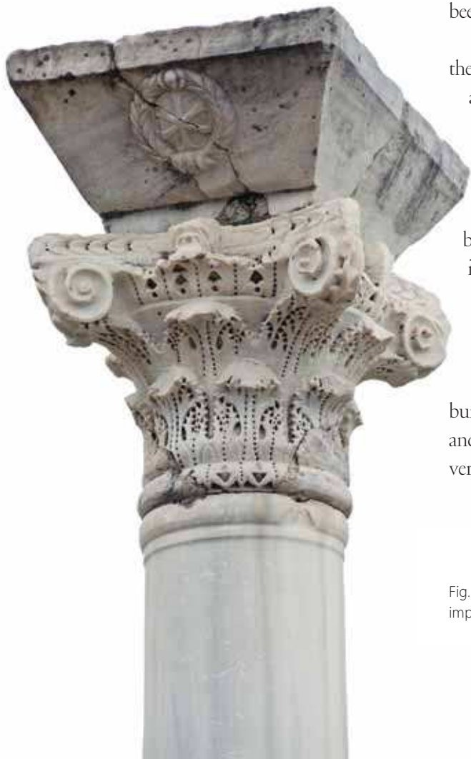
Fig. 141 | Thessalian Thebes, column, capital, and impost of Prokonnesian marble from Basilica A.

The most commercially active area of the city, however, must have been the main paved street to the east of Basilica A, revealed up to a length of 72 feet (22 m), lined by shops and running almost parallel to the seawalls (fig. 138:12). The brief excavation report of 1973 on this street and its shops records "many successive stories, basements, pithoi, graves and clay drainage pipes of various dates . . . density of buildings . . . continuing repairs and renovation of them," indicating how intensively life pulsed through this neighborhood in front of the city's harbor. 35 It is most probably here that Eusebios, a merchant (πραγματευτὴς) from Tenedos, and Onessimos, selling pickles at the market (σαλαγαμαρίου εἰς τὴν ἀγοράν), as recorded on their gravestones, did their business. 36 Other installations that (most probably) served the port's high volume of traffic, both in people and merchandise,