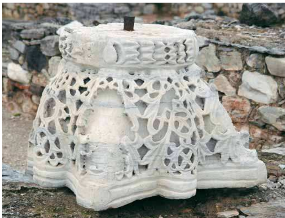
Fig. 139 | Fold-type impost capital of Constantinopolitan style. From Basilica C at Thessalian Thebes. Nea Anchialos, Archaeological Collection.

Given its overall dimensions (290 x 88 feet [88.50 x 26.80 m], including its two narthexes and atrium to the west) and lavish decoration, Basilica C is by far the largest and most imposing church that has