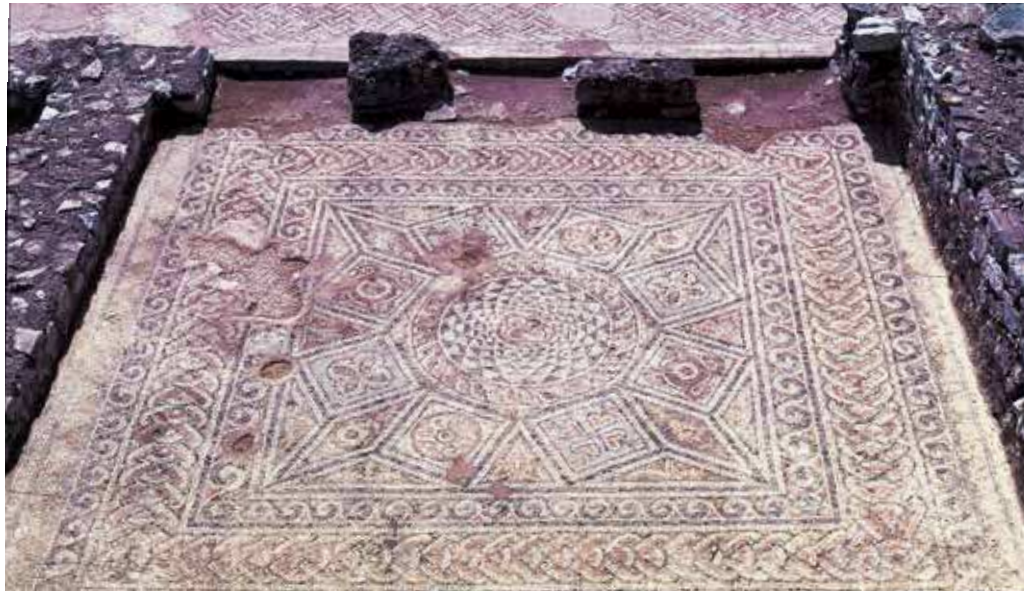
Fig. 145 | Mosaic floor with geometric motifs. Thessalian Thebes, "Cemetery Basilica," north aisle, rectangular room with tribelon.

Since intramural burials were normally forbidden during Late Antiquity, these at Thebes must have been performed during a period when restrictions on burials within the walls were lifted owing to a change in religious attitudes (triggered possibly by increasing insecurity in the extramural areas) or when the city was undergoing a considerable decline that did not allow the living to invest much time and effort on the burial of their dead. The burials of the first phase to the northeast of Basilica A could be regarded as burials ad sanctos , and their presence within the city walls explained in terms of changing attitudes and beliefs towards the afterlife. The second phase burials, however, as well as the burials