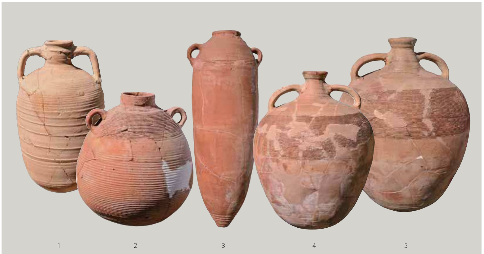
Fig. 146 | Examples of Late Roman Amphorae (LRA) excavated at Nea Anchialos. Nea Anchialos, Archaeological Collection.

circulated widely in the Mediterranean during the fifth and sixth centuries. Indicative examples are vessels of the so-called Late Roman Amphora 2 type of Aegean origin (fig. 146:4–5), the Late Roman Amphora 1 from Cilicia, North Syria and Cyprus (fig. 146:1), the Late Roman Amphora 3, carrying the famous Gaza wine (fig. 146:3), and the bag-shaped Late Roman Amphora 4 from Palestine (fig. 146:2). 54 Further evidence of close contacts between Thebes and the central western Aegean coast—this time through “religious tourism” and other travel—is offered by a group of clay pilgrimage ampullae (tiny vessels) found at Nea Anchialos (fig. 147) that have been linked to Ephesian workshops active between the fifth and seventh centuries. 55 It is generally assumed that these ampullae were filled with the well-known “manna,” the miraculous dust that rose from the grave of St. John the Theologian at Ephesus every year on May 8 and was offered to pilgrims as a cure-all. Thebes’s trading partners are further identified to a certain extent by coin finds. On the basis of what has been reported in interim excavation reports, more than 1,800 coins have been unearthed at Thebes to date,