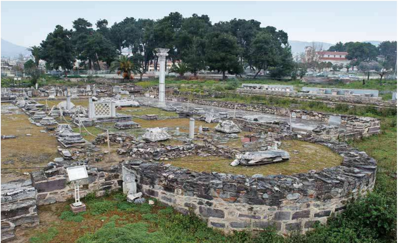
Fig. 140 | Thessalian Thebes, Basilica A (of Saint Demetrios) from the east-southeast.

come to light in Thebes so far 18 (fig. 136). The church was decorated with marble slabs (center aisle), mosaic floors (side aisles), frescos, and marble furnishings of the highest quality. The openwork impost capitals of the “fold” type in the naos, in particular, are directly linked to Constantinopolitan workshops in terms of both material (Prokonnesian marble) and workmanship 19 (fig. 139). Some years later, possibly around the end of the sixth century, certain repairs were carried out in Basilica C at the initiation and expense of the hierarch (prelate) Peter, as duly recorded in the metrical mosaic inscription in its south aisle. 20 The whole complex seems to have been in use until about the end of the seventh century, when it was destroyed by fire, as indicated by the heavy layers of ash and the pieces of calcined sculpture discovered during excavations. 21