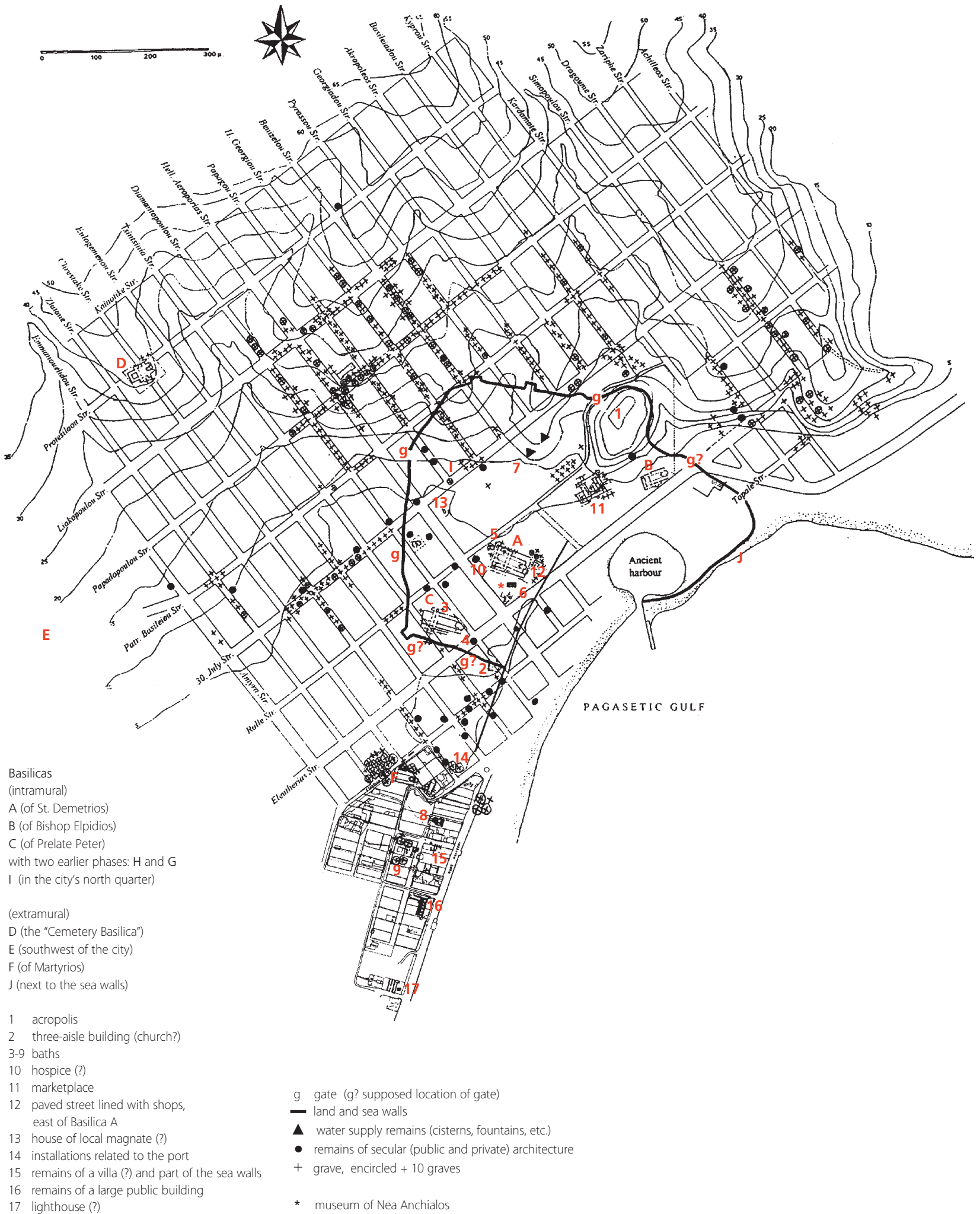
Fig. 138 | Topographical map of Nea Anchialos showing the excavated remains of Thessalian Thebes (based on Karagiorgou 2001b, fig. 2, and Dina 2009, fig. 2).