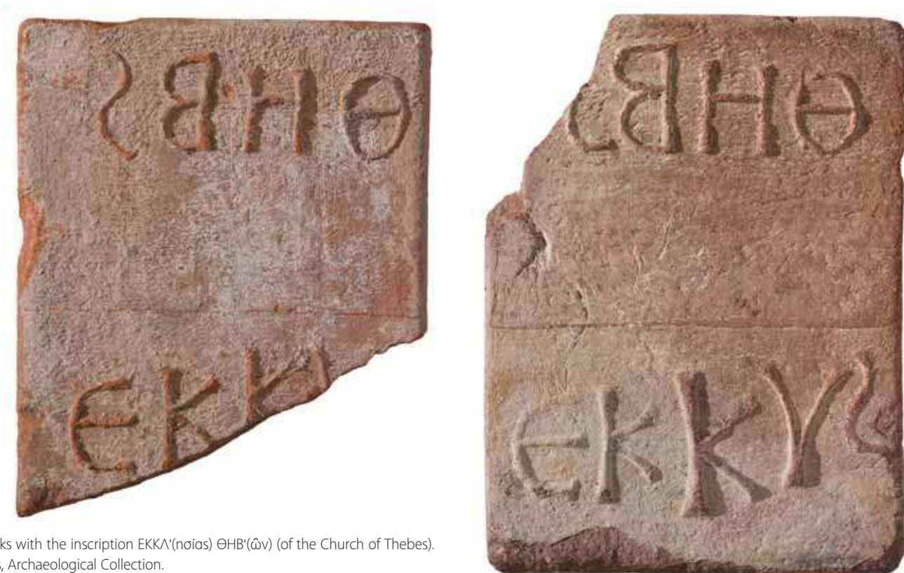
Fig. 137 | Bricks with the inscription ΕΚΚΑ(νοίας) ΘΗΒ(ῶν) (of the Church of Thebes). Nea Anchialos, Archaeological Collection.

In the Synekdemos of Hierokles, a geographical listing of all the cities of the Eastern Roman Empire dated before 535, Thessalian Thebes (henceforth simply Thebes) ranks third among the cities of the province of Thessaly, one of the six provinces of the diocese of Macedonia under the Praefectura Praetorio per Illyricum. 5 The plethora of archaeological vestiges unearthed in Nea Anchialos attests to the civic character of Thebes, its role as an important