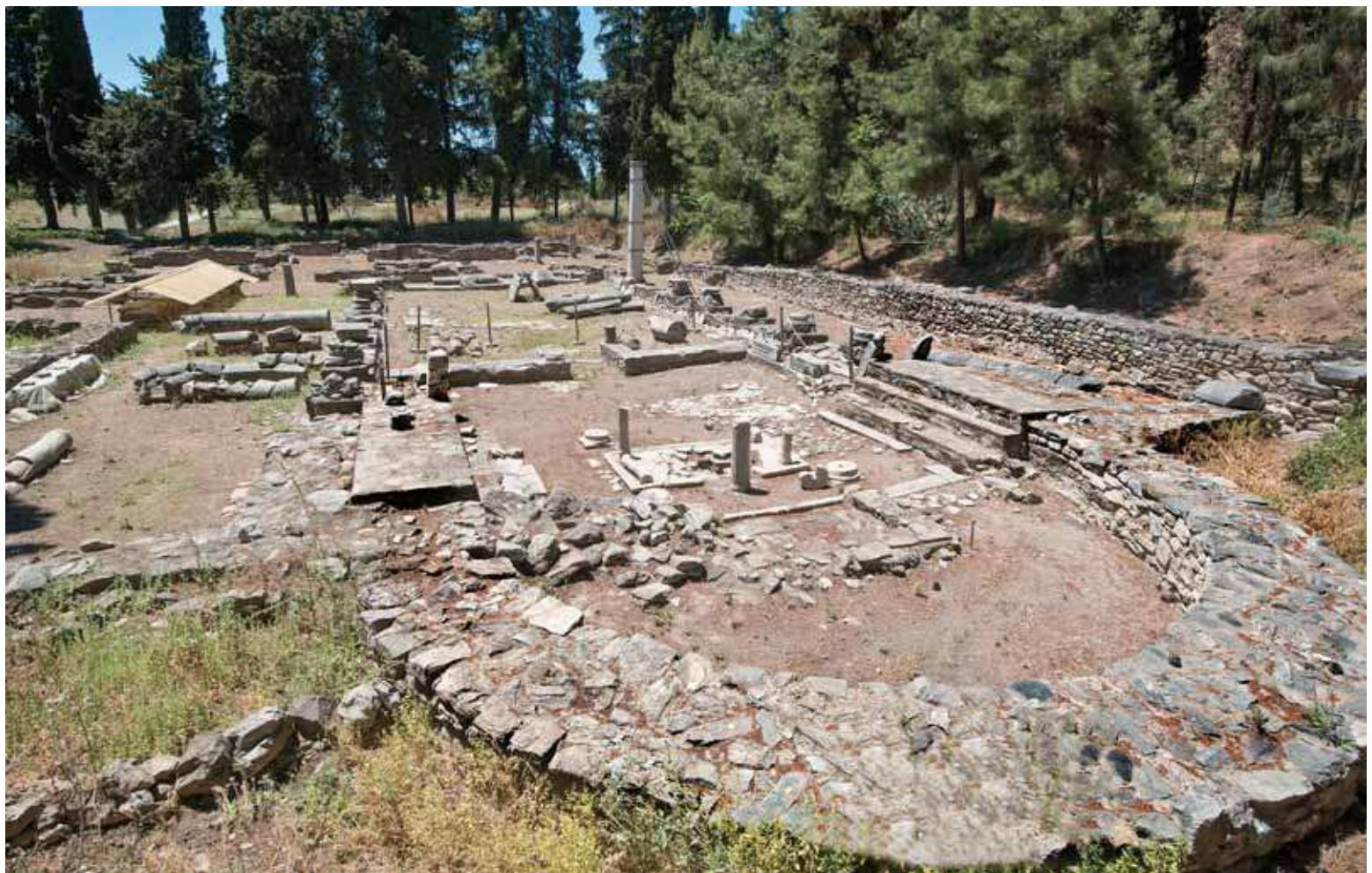
Fig. 142 | Thessalian Thebes, Basilica B (of Elpidios) from the east-southeast.

Of these four extramural basilicas, Basilica E, in the southwest outskirts of the city (fig. 138:E), and Basilica J, to the southeast, almost next to the sea (fig. 138:J), need to be further investigated. 41 Much better studied are the so-called Basilica F or "Basilica of Martyrios" and Basilica D or the "Cemetery Basilica." The "Basilica of Martyrios," situated to the southwest of the city, is a three-aisle basilica with narthex, possibly an atrium (not excavated as yet) and annexes, built over the remains of an unidentified fourth-century building 42 (fig. 138:F). The north aisle and the narthex have mosaic floors with dedicatory inscriptions. The number in Greek letters included in the dedicatory inscription of the narthex was read as 431, and interpreted as the basilica's construction date. 43 Apart from the reasonable suggestion that this number may simply present an enigmatic isopsephy, the mosaic decoration of the