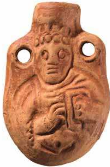
Fig. 147 | One of a group of similar clay pilgrim ampullae excavated at Nea Anchialos. Nea Anchialos, Archaeological Collection.

Of course monetary poverty does not necessarily indicate a standstill of all economic activity and a settlement's definite decline. In the case of Thebes, however, this phenomenon is combined with the city's almost total eclipse from the literary records of the seventh and eighth centuries. The information that in 676 the besieged Thessalonians searched for food supplies "εἰς τὰ τῶν Θηβῶν καὶ Δημητριάδος μέρη" (as recorded in the Miracles of St. Demetrios ) and the mention of the bishop of Giebas (ὁ Γνέβας) for Thebes in the so-called Iconoclastic Notitia (Codex Parisinus Graecus 1555A), dated between 787 and the end of the ninth century, offer no tangible evidence of Thebes's urbanism. 59 More telling is once again the city's archeological record: the subdivision of elaborate interior spaces into rooms for more utilitarian functions (as attested in Basilicas A and C) and the encroachment on public or previously inhabited space by disorderly burials