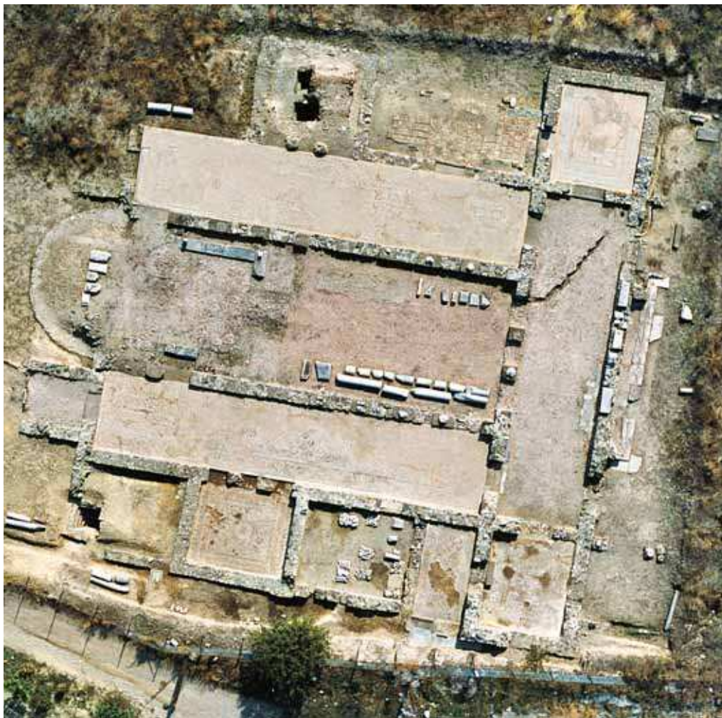
Fig. 144 | Aerial photograph of the "Cemetery Basilica" at Thessalian Thebes from the 1980s.

Thebes and the nearby Demetrias were the places where the whole of the province of Thessaly encountered the rest of the world through seaborne commerce. The fact that Thessaly was able to sustain two ports in the Pagasetic Gulf is in itself indicative of the amount of trade carried out there during Late Antiquity. A large part of this trade undoubtedly involved agricultural and other goods from Thessaly. The province counted as one of