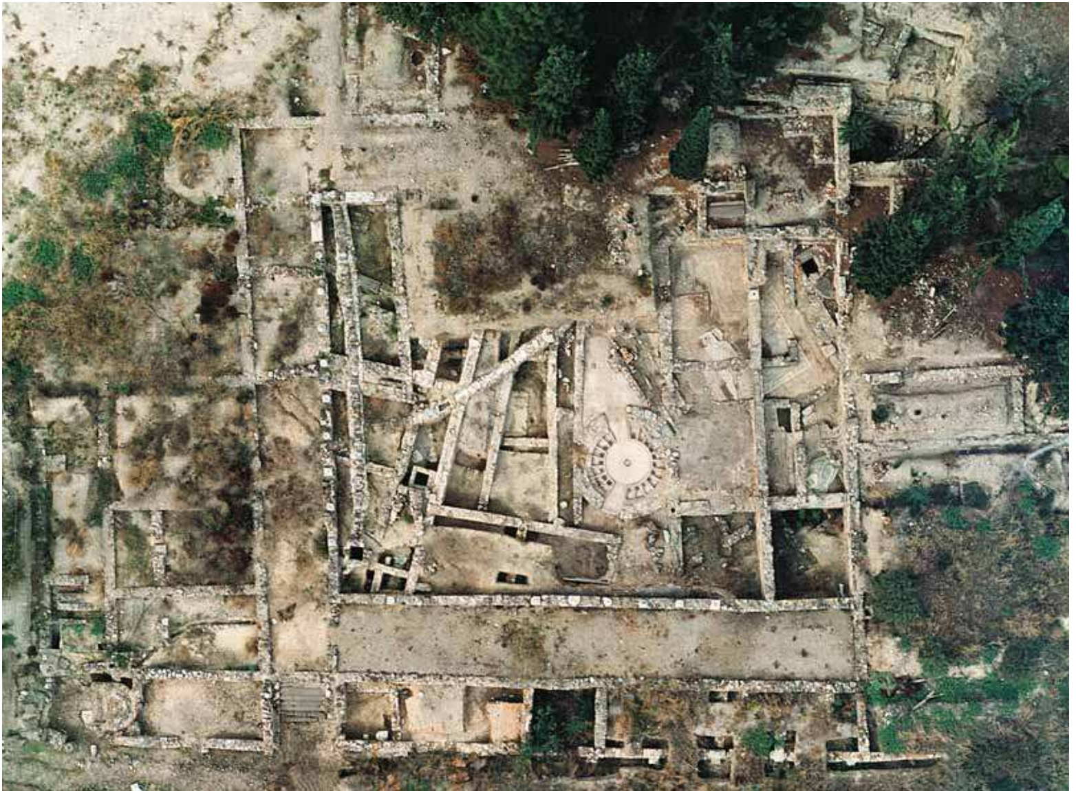
Fig. 143 | Aerial photograph of the “marketplace” at Thessalian Thebes from the 1980s.

basilica clearly indicates, in our view, a somewhat later construction date (possibly in the first half of the sixth century). 44 Coin finds associated with a thick layer of ash suggest that the church was destroyed by fire around the end of the second decade of the seventh century.