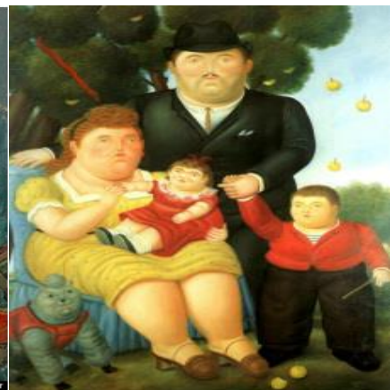
Fernando Botero, Una Familia