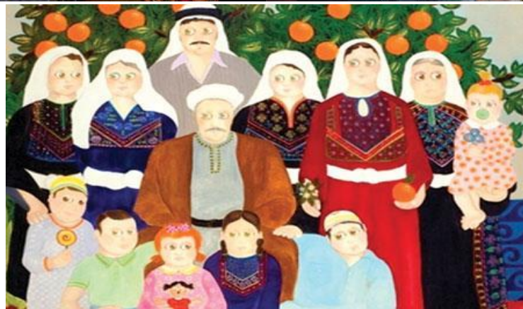
Unknown, Falah al-Bayarah