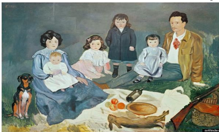
Pablo Picasso, Family at breakfast