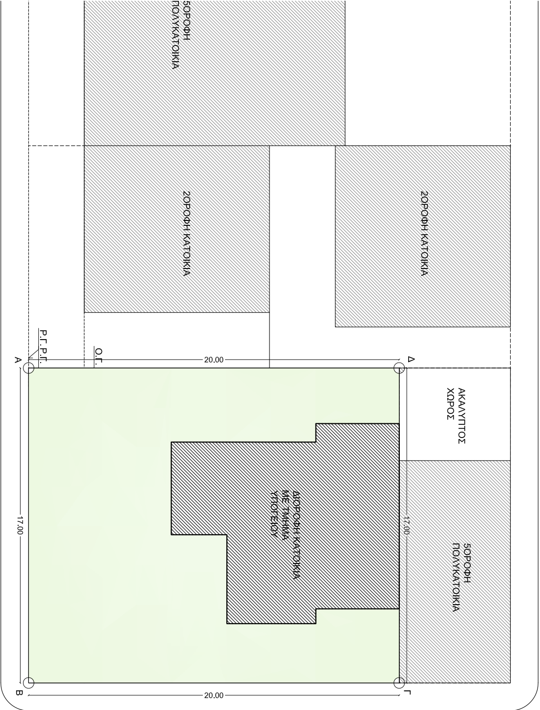
ΟΔΟΣ ΣΧΕΔΙΟΥ ΠΟΛΗΣ (10μ)