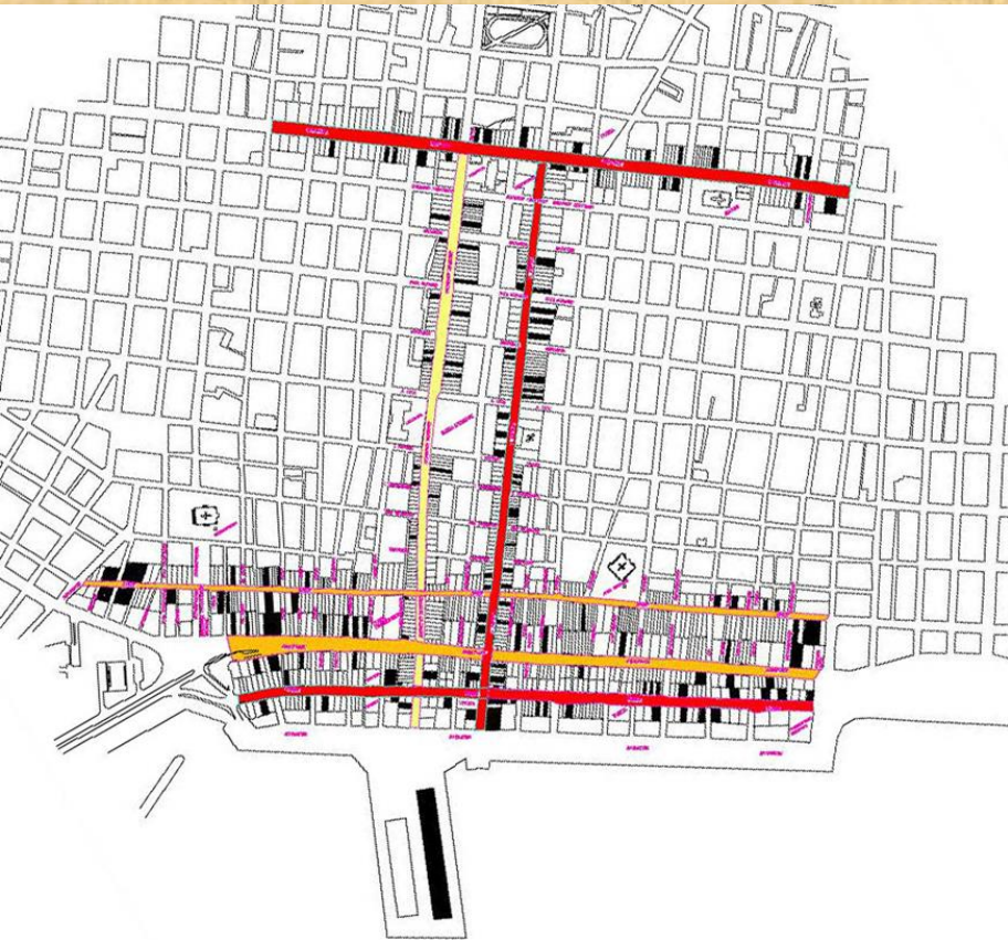
ΒΟΛΟΣ – κέντρο Μάιος 2011