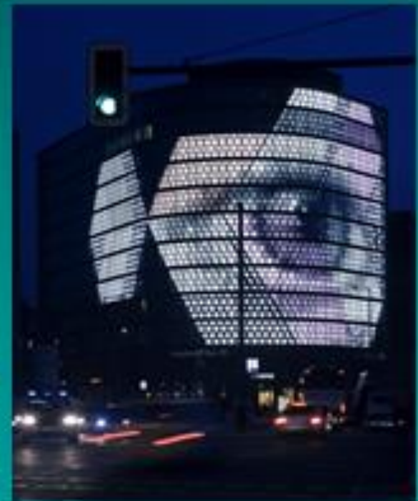
Βερολίνο περιοχή Potsdamer Platz