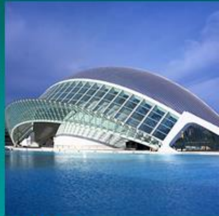
Βαλένθια – 'πόλη τεχνών & επιστημών'