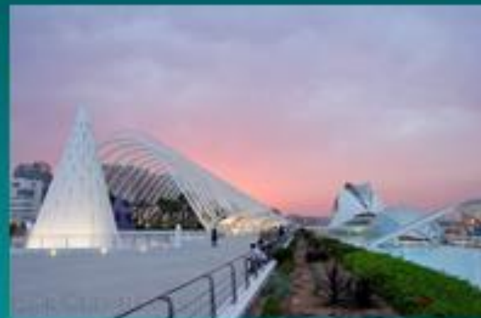
Βαλένθια – ‘πόλη τεχνών & επιστημών’