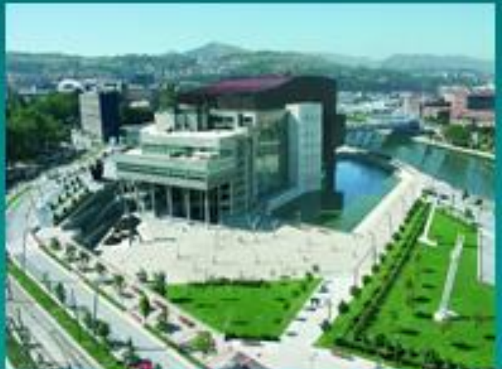
Euskalduna Concert & Congress Hall

Bilbao: περιοχή Abandoibarra κατά μήκος του ποταμού Nervión, όπως ήταν στα πρώτα στάδια της ανάπλασης