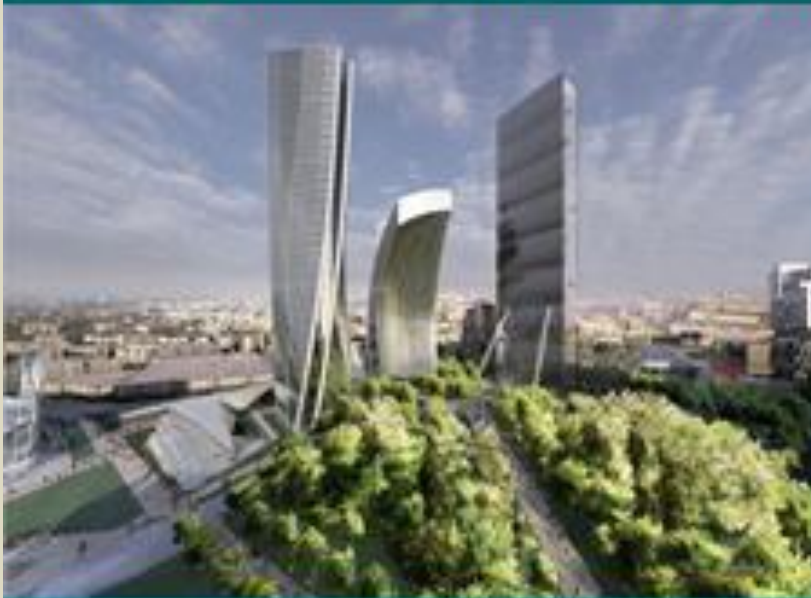
Μιλάνο, περιοχή Milan Fair

Πρόσφατα παραδείγματα Ευρωπαϊκών μητροπόλεων την τελευταία δεκαετία