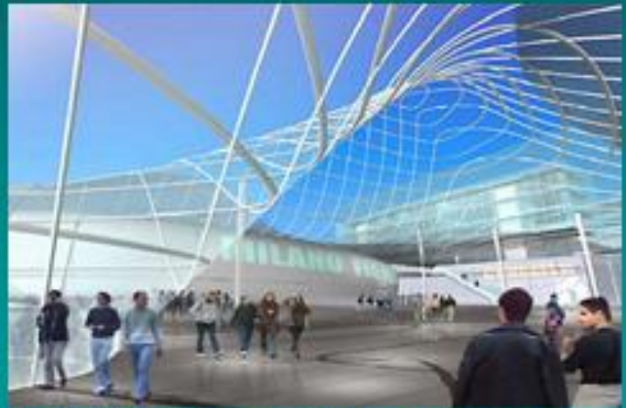
'City life' – το 1 ο βραβείο του διεθνούς διαγωνισμού που κέρδισαν οι Zaha Hadid, Arata Isozaki, Daniel Libeskind and Pier Paolo Maggiora.