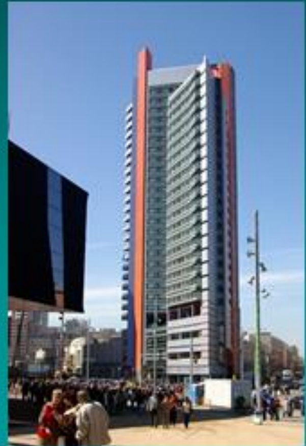
Barcelona Forum of the Cultures 2004