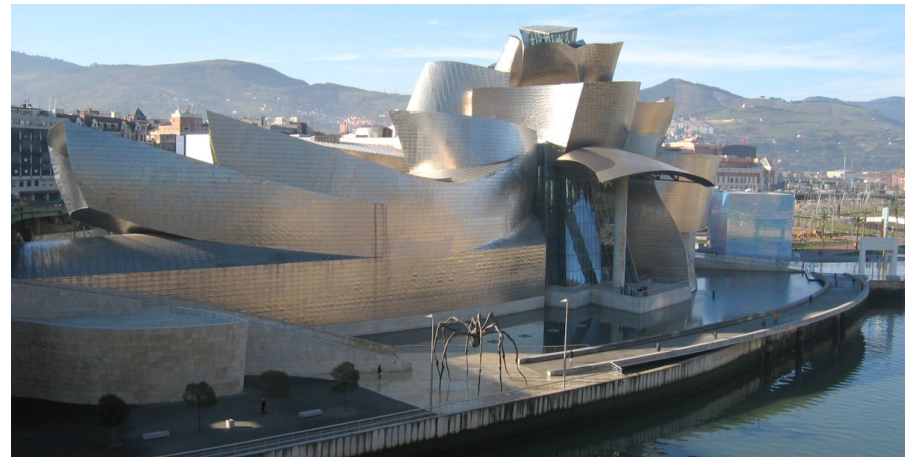
Το Μουσείο Τέχνης Guggenheim στο Μπιλμπάο