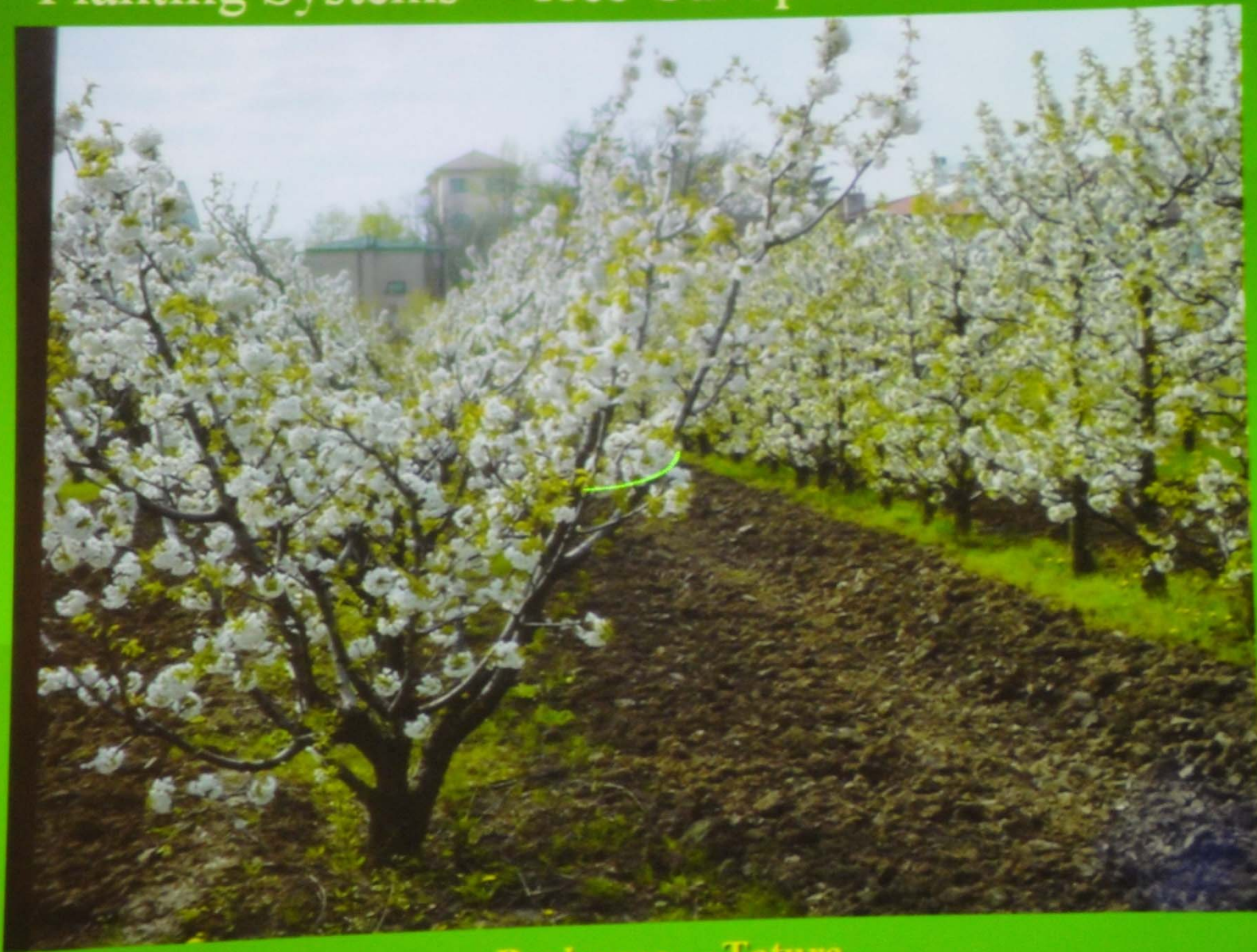
Bush vase → Tatura