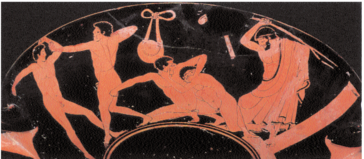
6. Σκηνές από ασκήσεις στα βαρέα αγωνίσματα. Αριστερά αγώνας πυγμαχίας και δεξιά παγκρατίου, όπου η προσπάθεια του ενός από τους αθλητές να τραυματίσει τα μάτια του αντιπάλου του προκαλεί την παρέμβαση του κριτή. Αττική ερυθρόμορφη κύλικα, α' τέταρτο 5ου αι. π.Χ. Λονδίνο, Βρετανικό Μουσείο.

Η πραγμάτωση όλων αυτών επέβαλε επιπλέον την ακριβή γνώση της ποιότητας, της χρήσης και της διάκρισης των γυμνασίων και των υπόλοιπων γυμναστικών μέσων, ιδιαίτερος των τρίψεων και των λουτρών, τα οποία, κατά τον Γαληνό, αποτελούσαν βασικά μέρη της υγιεινής διαίτας. Ως προς τα γυμνάσια σημειώνεται αρχικά μια γενική διάκριση σε «γυμνάσια», που περιλαμβάνουν ασκήσεις για τη γύμναση του σώματος και σε «γυμνάσια ἄμα καὶ ἔργα», που περιέχουν γυμναστικές δραστηριότητες που αποβλέπουν παράλληλα και σε πρακτικούς σκοπούς, και εν συνεχεία σε ενεργητικές, παθητικές και μεικτές ασκήσεις (λόγου χάρη η ιππασία), αλλά και ειδικότερη διάκριση σχετικά με την ποιότητα, την ταχύτητα, τον τόνο, τη διάρκεια και την ένταση της χρήσης, και την επίδρασή τους στα διάφορα μέρη του σώματος. 33