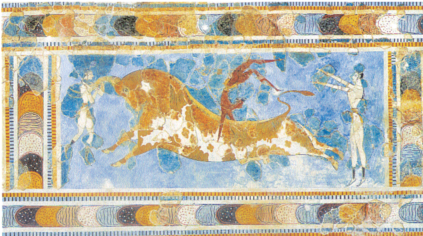
1. Τοιχογραφία με παράσταση ταυροκαθαψίων από το Ανάκτορο της Κνωσού, περ. 1500 π.Χ. Ηράκλειο, Αρχαιολογικό Μουσείο.

Ως φυσικό επακόλουθο αυτής της ολοκληρωτικής κριτικής της αθλητικής άσκησης και ως απάντηση στις επικρίσεις των διανοουμένων για τις συνθήκες τρυφλότητας και φιληδονίας που επικρατούσαν στα αυτοκρατορικά χρόνια αναπτύσσεται ο προβληματισμός σχετικά με την επίτευξη ενός συνετού κοινωνικού βίου, στα όρια του οποίου ο καθένας μπορεί να ελέγχει τις πράξεις του και τις συνθήκες δράσης του. Γίνεται λόγος για συστηματοποίηση της υγιεινής διαίτας / τέχνης, η οποία, ως μέρος της ιατρικής επιστήμης, αναλύεται σε μια τέχνη του «ζην», ευνοεί τη συνεργασία ιατρικών και γυμναστικών μεθόδων, συμβάλλει στην καλύτερη διαχείριση του σώματος και στοχεύει να ρυθμίσει τις ανθρώπινες δραστηριότητες σε σχέση με την ατομική ιδιοσυγκρασία και σε συνάρτηση με τις εξωτερικές μεταβλητές. 13 Στην τεκμηρίωση αυτής της διαιτητικής λογικής εκτός από τα ιατρικά και υγιεινά πορίσματα συνδράμουν και οι φιλοσοφικές αντιλήψεις, όπως της νεοστωικής σχολής, που επιτάσσουν την καλλιέργεια της εσωτερικής ελευθερίας του ατόμου, χωρίς την κοινωνική απομόνωση και την υποβάθμιση της ιδιωτικής του ζωής. 14