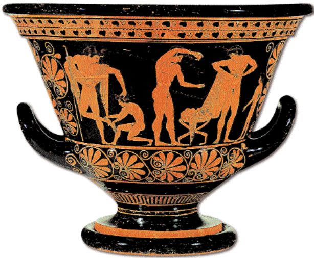
5. Ένα παιδί προσπαθεί να αφαιρέσει αγκάθι από το πόδι νεαρού αθλητή ενώ δύο ακόμη αθλητές φροντίζουν οι ίδιοι για την προετοιμασία τους πριν τον αγώνα. Αττικός καλυκωτός κρατήρας του Ευφρονίου. Βερολίνο, Antikemuseum, Staatliche Museen Preußischer Kulturbesitz.

ρά, να έχει επαρκή γνώση των ιδιοτήτων των γυμνασίων και των γυμναστικών μέσων και, από την άλλη πλευρά, να λαμβάνει υπόψη του την ανθρώπινη διαφορετικότητα, γιατί μόνο τότε είναι δυνατόν να επιλέξει και να εφαρμόσει τα σύμμετρα, κατά περίπτωση, γυμνάσια. Θεωρείται κατακριτέα η πρακτική γιατρών και γυμναστών να γενικεύουν γυμναστικές και υγιεινές προτάσεις και να υποστηρίζουν ότι αυτό που ταιριάζει σε μια σωματική διάθεση αρμόζει σε όλες. 32