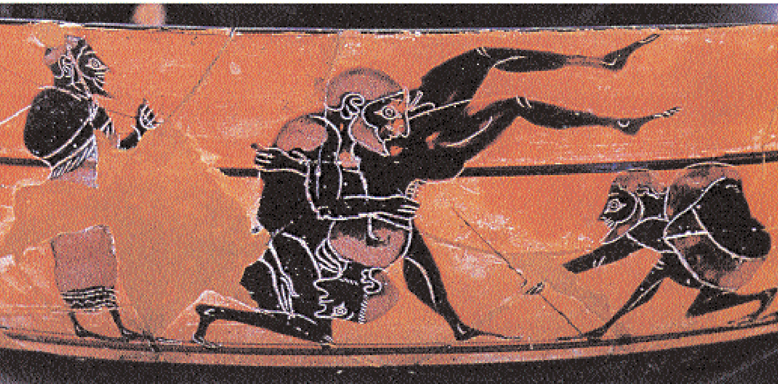
2. Σκηνή πάλης, με την αρχαία ονομασία «αναβαστάσαι εις ύψος». Μελανόμορφη κύλικα, μέσα 6ου αι. π.Χ. Φλωρεντία, Αρχαιολογικό Μουσείο.

Όλες αυτές οι καινοτόμες απόψεις δεν γίνονταν αναντίρρητα αποδεκτές. Προκαλούσαν αντιπαραθέσεις που