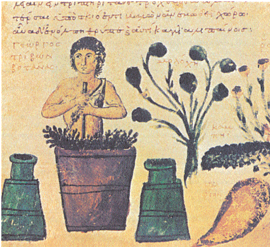
ροί έλκη, ούρα κινεί, βοηθεί σκορπιοπλήκτοις, έλμινθα 4. Παρασκευή φαρμάκου. Από χειρόγραφο κώδικα του έργου του φαρμακολόγου και γιατρού Νικάνδρου Θηριακά και Αλεξιφάρμακα , 10ος αι. Παρίσι, Εθνική Βιβλιοθήκη.

πλατείαν εκβάλλει, λίθους φθείρει, φλεγμονήν πραΰνει, τον στόμαχον αμβλύνει, εμέτους κινεί, φλεγμονάς ιάται, αλωπεκίας θεραπεύει, ψύχει, λύει κεφαλαλγίας κ.λπ.). Γενικά θα μπορούσαμε να πούμε ότι «δύναμις» είναι η ικανότητα ενός φαρμάκου να προκαλεί κάτι (οτιδήποτε) στον ανθρώπινο οργανισμό. Όπως προκύπτει κι από τα παραδείγματα που δώσαμε, «δύναμις» είναι και το ότι ένα φάρμακο μπορεί να μεταβάλλει κάποιες «ποιότητες», να είναι π.χ. θερμαντικό ή ψυκτικό, ή να προκαλεί εμετό ή κένωση – και μάλιστα να απομακρύνει (με εμετό ή κένωση) ένα συγκεκριμένο χυμό, αποκαθιστώντας έτσι την «ισορροπία». Αλλά η έννοια της «δύναμης» δεν περιλαμβάνει βέβαια μόνο αυτά.