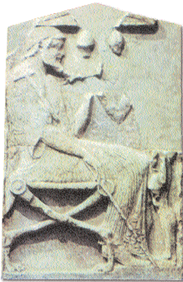
5. Ανάγλυφο που απεικονίζει γιατρό, όπως συμπεραίνεται από τις δύο σκύες (ιατρικά κύπελλα) κάτω από το αέτωμα της στήλης. Τέλος δου αι. Βασιλεία, Μουσείο Τέχνης.