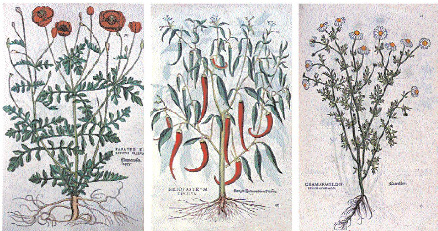
2. Απεικονίσεις φαρμακευτικών φυτών: παπαρούνα, τσίλι, χαμομήλι. Από την εγκυκλοπαίδεια του Leonhart Fuchs De historia stirpium .

ανάμεσα στο 60 και το 78 μ.Χ. Ο Διοσκουρίδης γεννήθηκε στην Ανάζαρβο της Κιλικίας και ταξίδεψε σε πολλές χώρες –κατά μία, όχι βεβαιωμένη, εκδοχή, ως γιατρός στα ρωμαϊκά στρατεύματα– και είχε την ευκαιρία να γνωρίσει από κοντά πολλά φαρμακευτικά φυτά και τις χρήσεις τους σε διάφορους λαούς και περιοχές. Η σημασία του έργου του Διοσκουρίδη έγκειται τόσο στον όγκο των γνώσεων που περιέχει όσο και στην επίδραση που άσκησε στους περισσότερους κατοπινούς συγγραφείς μέχρι την Αναγέννηση, αλλά και αργότερα. 7