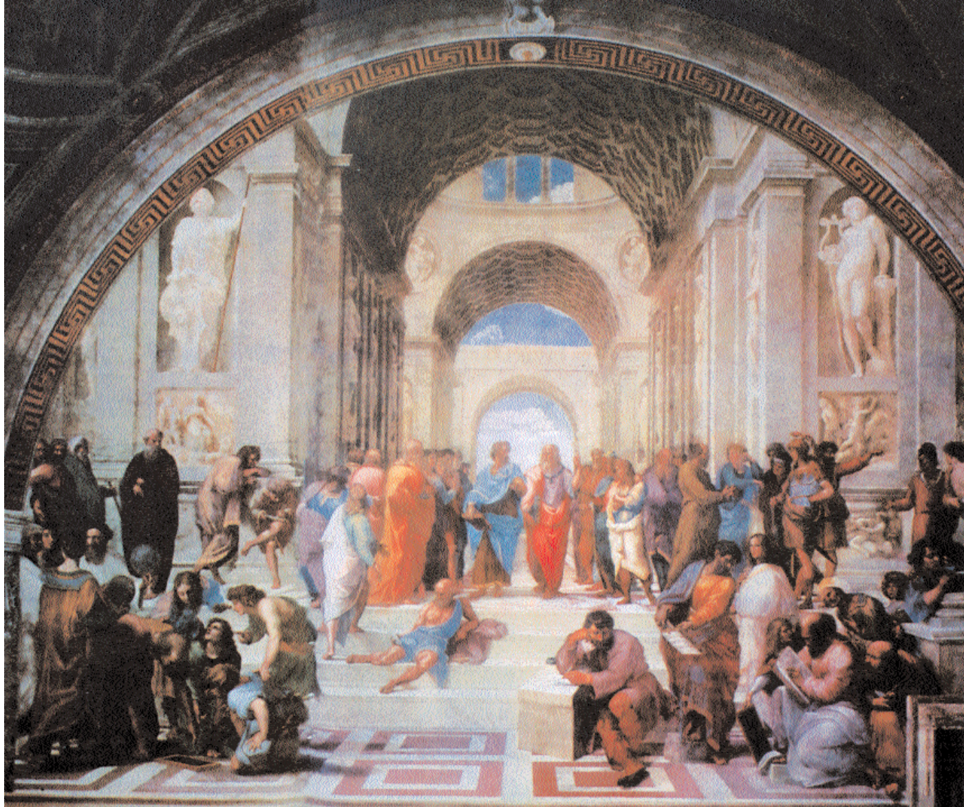
4. Η «Σχολή των Αθηνών». Ο Πλάτων και ο Αριστοτέλης συζητούν στο κέντρο της σύνθεσης, ανάμεσα σε άλλους φιλοσόφους. Έργο του Ραφαήλ (1509-1511).

λιδιώντας, ἐκχωρήσω δὲ ἐργάτησιν ἀνδράσι πρήξιος τῆσδε». Ο Ιπποκρατικός γιατρός δουλεύει κυρίως διανοητικά, διδάσκεται φιλοσοφία και ασχολείται μόνο με τα γνωστικά του αντικείμενα. Οι ασχολούμενοι με τις χειρουργικές πράξεις είναι, κατά την εποχή του Ιπποκράτη όπως και για πολλούς αιώνες μετά, χειρωνακτες-εμπειροτέχνες και ενώ μπορούσαν να ωφεληθούν, ήταν πολύ πιθανό και να βλάψουν, γεγονός που για τα ορκισμένα μέλη της ιατρικής συντεχνίας ήταν μη αποδεκτό.