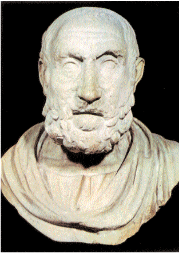
2. Ρωμαϊκό αντίγραφο προτομής του σημαντικότερου γνωστού γιατρού της αρχαιότητας, του Ιπποκράτη. 4ος αι. π.Χ. Νεάπολη, Εθνικό Μουσείο.

δική αυτή αναφορά δείχνει το κύρος των συγκεκριμένων αντιλήψεων, αλλά και του συγκεκριμένου βιβλίου του Ιπποκράτη, σταθερά από την εποχή που γράφτηκε (περ. 6ος αι. π.Χ.) ως τα χρόνια του Σωρανού (2ος αι. μ.Χ.). Στην αρκετά μεταγενέστερη Σούδα (ή Σουίδα), στο λήμμα «Ιπποκράτης», τα έργα του κορυφαίου γιατρού ομαδοποιούνται, ενώ ο Όρκος αναφέρεται πρώτος και ξεχωριστά από τα άλλα: «Πρώτη μὲν οὖν βίβλος, ἢ τὸν ὄρκον περιέχουσα, δευτέρα δὲ ἢ τὰς προγνώσεις ἐμφαίνουσα, τρίτη ἢ τῶν ἀφορισμῶν, ἀνθρωπίνων ὑπερβαίνουσα σύνεσιν. Τετάρτην τάξιν ἐχέτω ἢ πολυδρῦλος καὶ πολυθαύμαστος ἐξηκοντάβιβλος, ἢ πᾶσαν ἰατρικὴν ἐπιστήμην τε καὶ σοφίαν ἐμπεριέχουσα». 8 Το γεγονός δείχνει και πάλι το κύρος του Όρκου κατά τους βυζαντινούς αιώνες – κάτι, βεβαίως, που συνεχίζεται ως τις μέρες μας.