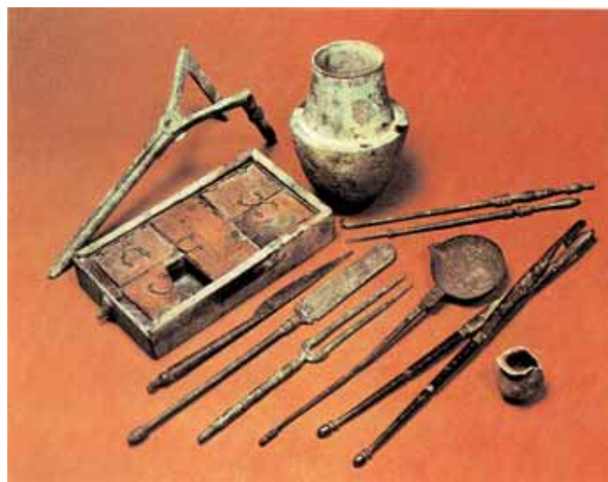
4. Διάφορα ιατρικά όργανα, όπως νυστέρι, αιμοστατική λαβίδα και καθετήρες. Ευρήματα που χρονολογούνται στην Ελληνιστική περίοδο, κατά τη διάρκεια της οποίας γνώρισε σημαντική ανάπτυξη ο κλάδος της ανατομίας. Λονδίνο, Βρετανικό Μουσείο.

Η δωρεάν προσφορά υπηρεσιών από γιατρούς σε πόλεις μαρτυρείται συχνά και είναι χαρακτηριστικά σχετικά δημόσια ψηφίσματα που τιμούν τέτοιους γιατρούς για την αυταπάρνησή τους. Η ιατρική γνώση αναπτύχθηκε βεβαίως και στις παρυφές του ελληνορωμαϊκού κόσμου,