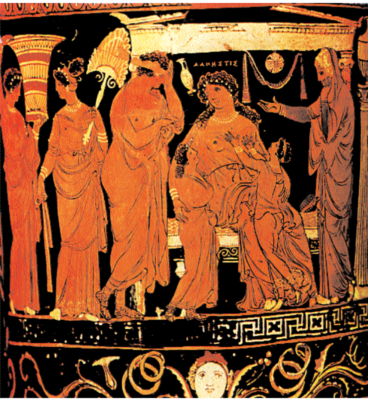
4. Μια από τις σπάνιες απεικονίσεις της τραγωδίας Άλκηστις του Ευριπίδη. Η μελλοθάνατη αποχαιρετά την οικογένειά της καθισμένη σε κλίνη – συνδεδεμένη με το «εκκύκλημα», μηχανήμα που χρησίμευε για την παρουσίαση στο κοινό «εσωτερικών» σκηνικών με ακίνητα πρόσωπα (νεκρά, άρρωστα ή κοιμισμένα). Απουλική λουτροφόρος, 4ος αι. π.Χ. Βασιλεία, Μουσείο Τέχνης.

μεταξύ των πολλών και ποικίλων, πνευματικής κυρίως και ηθικής τάξεως, αγαθοεργιών του προς τους ανθρώπους, ο Τίτανας διακρίνει («τὸ μὲν μέγιστον») την προσφορά του σε θεραπευτικά μέσα: «Ἐἴ τις ἐς νόσον πέσοι, / οὐκ ἦν ἀλέξην, οὐδὲν, οὔτε θρώσιμον, / οὐ χριστόν οὐδὲ πιστόν, ἀλλὰ φαρμάκων / χρεῖαι κατεσκεύλλοντο, πρὶν γ' ἐγὼ σφισιν / ἔδειξα κράσεις ἡπίων ἀκεσμάτων, / αἷς τὰς ἀπάσας ἐξαμύνονται νόσους» (στ. 478-483). 16