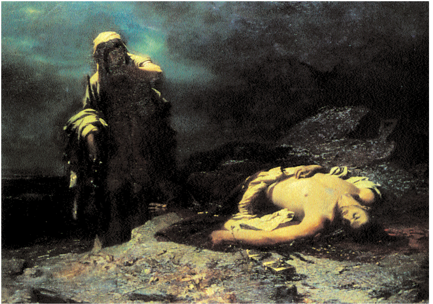
2. Η Αντιγόνη μπροστά στον νεκρό Πολυνείκη. Έργο του Νικηφόρου Λύτρα. Λάδι σε μουσαμά, 1865. Αθήνα, Εθνική Πινακοθήκη.

κής διαταραχής (η ερωτευμένη και κατόπιν απορριφθείσα Φαίδρα, η απατημένη Μήδεια). 5 Αναζητώντας καταρχάς να αντλήσουν μέσα από τις νόσους ό,τι πιο δραματικό και θεαματικό αυτές μπορεί να διαθέτουν, οι τραγικοί ποιητές επιλέγουν κατεξοχήν στιγμές «κρίσης», κρίση η οποία μπορεί να εκδηλώνεται είτε με τρόπο παθητικό (η περίπτωση της οιστηλατούμενης Ιούς στον Προμηθέα Δεσμώτη , του διωκόμενου από παραισθήσεις Ορέστη στο τέλος των Χορηφών και στην αρχή του Ορέστη ) είτε, κυρίως, με τρόπο ενεργητικό και μοιραία (αυτο)καταστροφικό (η περίπτωση του Αίαντα, του Ηρακλή Μαινόμενου, της Αγαύης, της Φαίδρας, της Μήδειας). 6