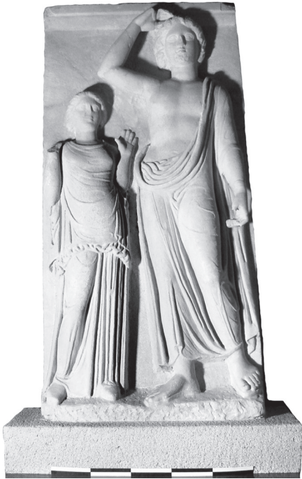
Εικ. 1. Αναθηματικό ανάγλυφο Αρχαιολογικό Μουσείο Βόλου Λ 782.