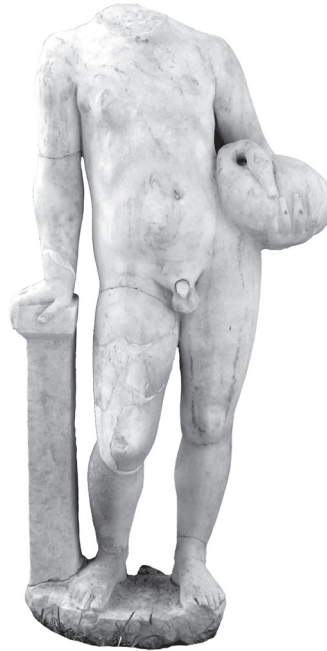
Εικ. 6. Αγαλμάτιο αγοριού Αρχαιολογικό Μουσείο Βόλου Λ 785.