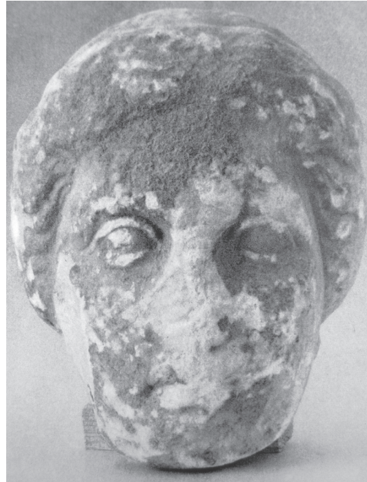
Εικ. 2. Γυναικείο κεφάλι από επιτύμβιο ανάγλυφο Αρχαιολογικό Μουσείο Βόλου Λ 513.