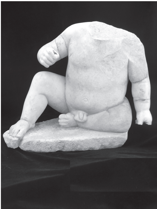
Εικ. 7. Αγαλμάτιο αγοριού Αρχαιολογικό Μουσείο Βόλου Λ 784.