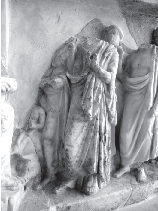
Εικ. 5. Αναθηματικό ανάγλυφο Αθήνα, Εθνικό Αρχαιολογικό Μουσείο 1377. Λεπτομέρεια.