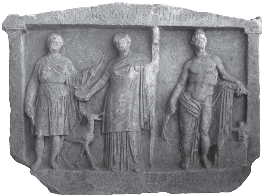
Εικ. 10. Αναθηματικό ανάγλυφο, Γόννοι, Αρχαιολογική Συλλογή.