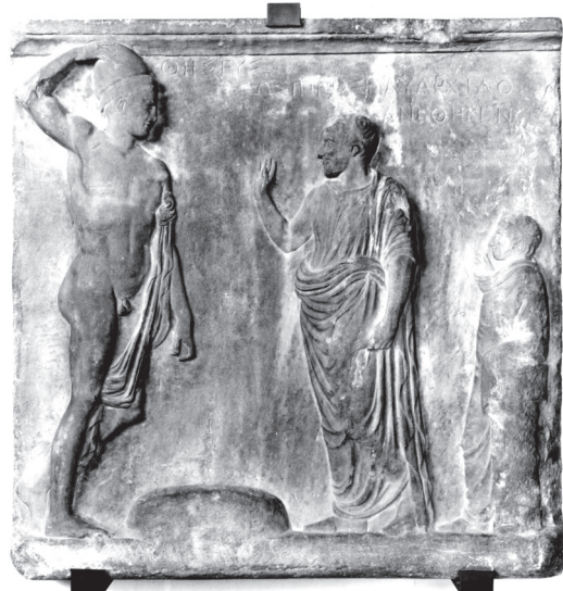
Εικ. 4. Αναθηματικό ανάγλυφο του Σωσίππου. Παρίσι, Μουσείο του Λούβρου MA 743.