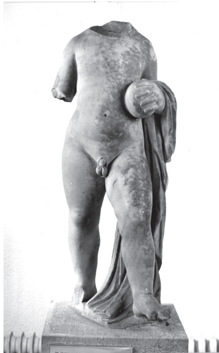
Εικ. 9. Αγαλμάτιο αγοριού Αρχαιολογικό Μουσείο Πειραιώς 246.