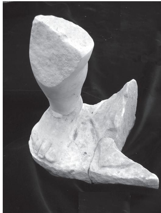
Εικ. 8. Θραύσμα αγαλματίου αγοριού Αρχαιολογικό Μουσείο Βόλου Λ 783.