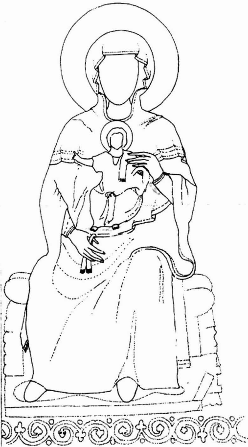
Αφαιρετικό σχέδιο της έnthρονης βρεφοκρατούσας Θεοτόκου στην Αγία Σοφία Θεσσαλονίκης

στην περίπτωση της πρώτης φάσης του ναού της Αγίας Σοφίας 15 . Το ίδιο επίθετο χρησιμοποιείται και στη γνωστή επιγραφή της βασιλικής της Αχει-