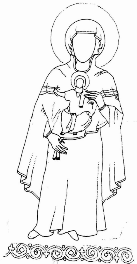
Αγία Σοφία Θεσσαλονίκης. Γραφική αποκατάσταση (εναλλακτική πρόταση στην περίπτωση που το μεσαίο τμήμα της διακοσμητικής ζώνης είναι το αρχικό)

Θεωρώντας, λοιπόν, το πάνω μέρος της παράστασης ως αρχικό τμήμα μιας όρθιας Θεοτόκου μπορούμε να εκτιμήσουμε καλύτερα την καλλιτεχνική αξία του έργου (εικ. 8, 9) 24 . Τα αυστηρά χαρακτηριστικά του προσώπου της Παναγίας, το κράτημα του ώμου του Χριστού όχι με το δεξί αλλά με το αριστερό της χέρι και ειδικότερα το αναπτυγμένο μαφόριο προς την ίδια πλευρά θα μπορούσαν να αποδοθούν στον εργαστηριακό κύκλο της Θεσσαλονίκης. Η αντικατάσταση του σταυρού με την παράσταση της όρθιας Θεοτόκου θα ταίριαζε πολύ καλά στο πρώτο μισό του 11ου αιώνα, με βάση τις αναλογίες του σώματος, καθώς θα μπορούσε να συνδεθεί με τις ψηφιδωτές παραστάσεις της Θεοτόκου στην Αγία Σοφία του Κιέβου και στη Νέα Μονή της Χίου 25 , μολοντί οι δύο τελευταίες ανήκουν σε διαφορετικό εικονογραφικό τύπο (εικ. 10).