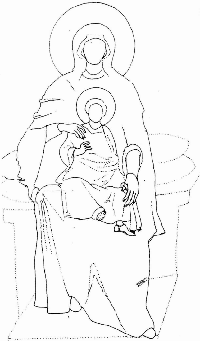
Αφαιρετικό σχέδιο της ένθρονης βρεφοκρατούσας Θεοτόκου στην Αγία Σοφία Κωνσταντινούπολης

Εκείνο που έχει ιδιαίτερη σημασία και διέλαθε της προσοχής όλων όσων ασχολήθηκαν με το θέμα είναι η παρουσία ενός κολοβού γράμματος στην προέκταση του δεύτερου διάστιχου. Όπως φαίνεται στις λεπτομέρειες των δημοσιευμένων φωτογραφιών διαγράφεται με χονδρές λευκές ψηφίδες, όμοιες με των υπολοίπων γραμμάτων και σαφώς μεγαλύτερες από εκείνες του ανθικού διακόσμου 7 (εικ. 1). Το γράμμα αυτό δε μπορεί να είναι άλλο παρά το μισό