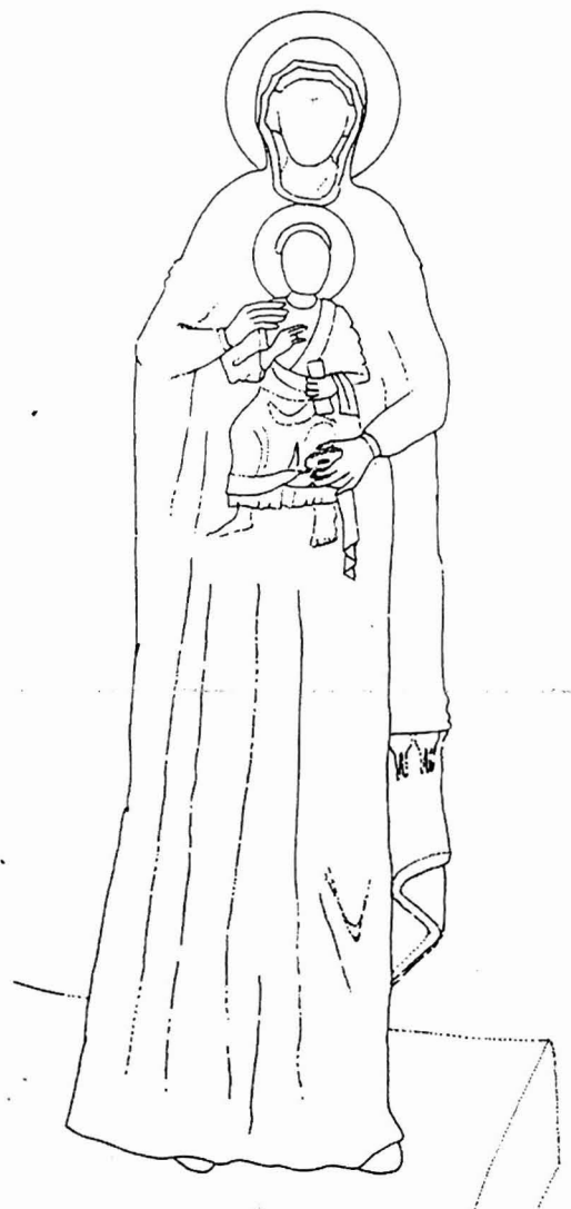
Αφαιρετικό σχέδιο της όρθιας βρεφοκρατούσας Θεοτόκου στο ναό της Κοιμήσεως της Θεοτόκου στη Νίκαια

Όμως τι μπορεί να συμβαίνει με το μοναδικό σωζόμενο όνομα της άλλοτε εικονομαχικής επιγραφής; Κάτω από ποιες συνθήκες διασώθηκε το όνομα του πολυσυζητημένου « Παύλου τοῦ ἁγιωτάτου ἀρχιεπισκόπου ... »; Ποιος ήταν, λοιπόν, αυτός ο επί-