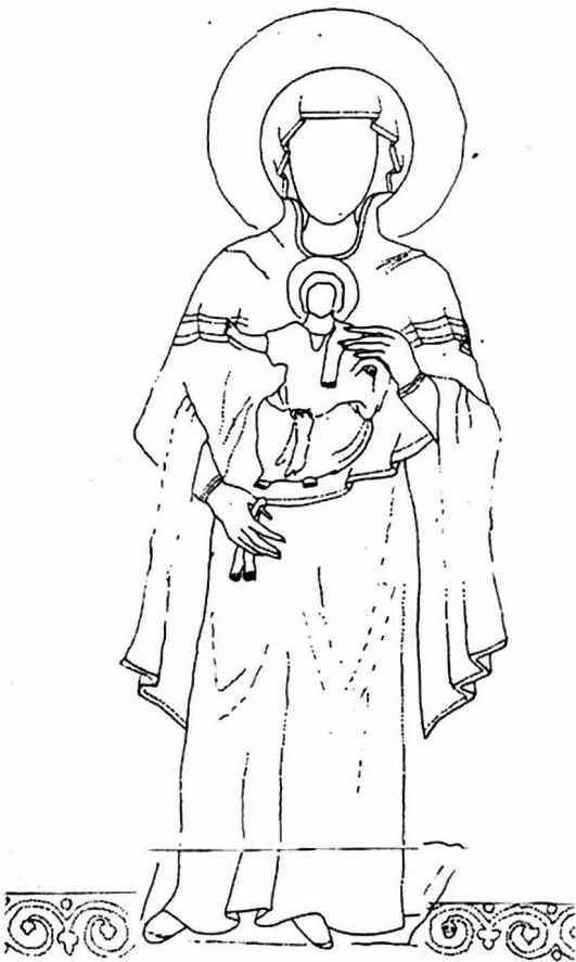
Αγία Σοφία Θεσσαλονίκης. Γραφική αποκατάσταση (εναλλακτική πρόταση με αφαίρεση της διακοσμητικής ζώνης στο τμήμα κάτω από το υποπόδιο)

λία. Η κοίλη επιφάνεια του τεταρτοσφαιρίου δεν επαρκούσε για την ανάπτυξη μιας παράστασης με ραδινές αναλογίες και τις απαιτούμενες διαστάσεις, έτσι ώστε να μη χάνεται στο χρυσό βάθος.