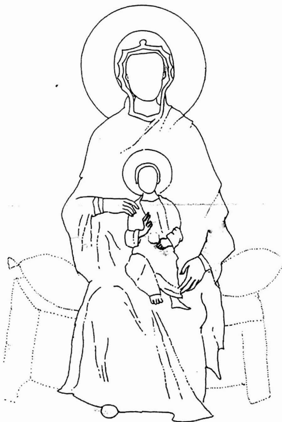
Αφαιρετικό σχέδιο της ένθρονης βρεφοκρατούσας Θεοτόκου στον Όσιο Λουκά

Ένα άλλο ζήτημα που σχετίζεται με την ιστορία του διακόσμου της Αγίας Σοφίας είναι η χρονολόγηση του ψηφιδωτού με την Πλατυτέρα στο τεταρτοσφαίριο της κόγχης του ιερού (εικ. 6). Ο Στυλιανός Πελεκανίδης είχε υποθέσει την άποψη περί ανακατασκευής του πάνω τμήματος της Παναγίας, έπειτα από κάποια τοπική καταστροφή, καταλήγοντας τελικά σε μια χρονολόγηση της επέμβασης στο ψηφιδωτό μέσα στο δεύτερο μισό του 12ου αιώνα 19 .