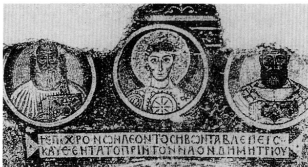
Εικ. 3. Βασιλική Αγίου Δημητρίου. Το ένθετο ψηφιδωτό με τα τρία μετάλλια και την επιγραφή.

παράδοσης. Η σχετική λοιπόν πληροφορία του παρισυνού κώδικα δεν αποτελεί από μόνη της αποδεικτικό στοιχείο για την επίλυση του προβλήματος. Για τη διαλεύκανση του όλου θέματος θα πρέπει να επιμείνουμε στην αναζήτηση μιας λύσης που να προκύπτει μέσα από την ίδια την επιγραφή εξαντλώντας κάθε ενδεχόμενο.