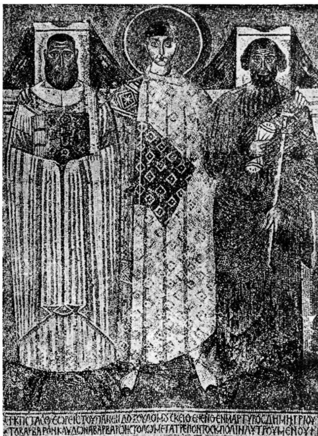
Εικ. 1. Βασιλική Αγίου Δημητρίου Θεσσαλονίκης. Το ψηφιδωτό των κτητόρων.

η επιγραφή να είχε εξεταστεί, ευθύς εξαρχής, χωρίς το τελικό N στη λέξη CTOΛΩ και μόνο σε περίπτωση αδιεξόδου θα μπορούσε να εκληφθεί ως γενική πληθυντικού. Στη συγκεκριμένη φράση δεν έχουμε τίποτε άλλο παρά μία απλή δοτική ( στόλω ), η οποία ταιριάζει πολύ καλά με τα συμφραζόμενα και υπακούει σε δόκιμο συντακτικό τύπο. Επισημαίνεται ότι δίπλα στο Ω (ωμέγα) ένα μικρό προσγεγραμμένο I (ιώτα) δηλώνει την πτώση του ουσιαστικού. Επομένως ολόκληρο το