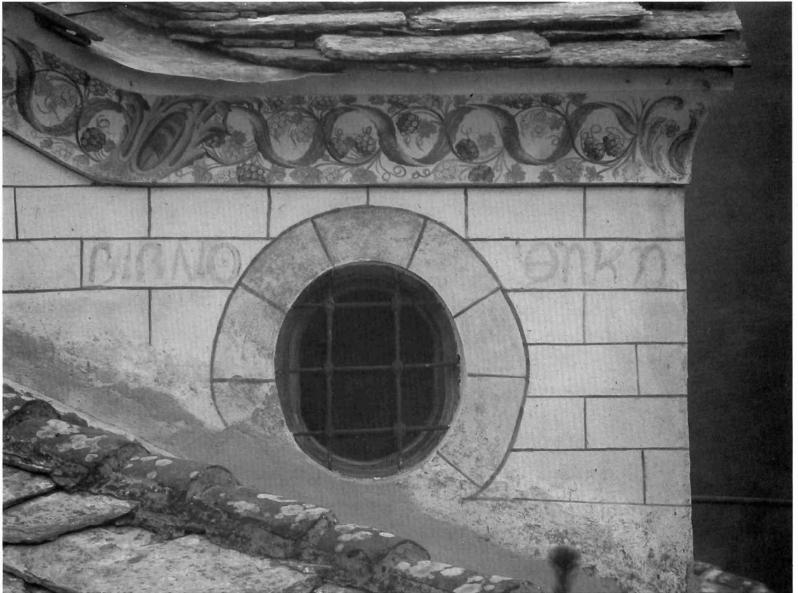
Εικ. 6. Μονή Τιμίου Προδρόμου Σερρών. Καθολικό. Παρεκκλήσι Αγίου Νικολάου. Δυτική πρόσοψη. Λεπτομέρεια όπου διακρίνεται η γραπτή επιγραφή «βιβλίο...θήκη».