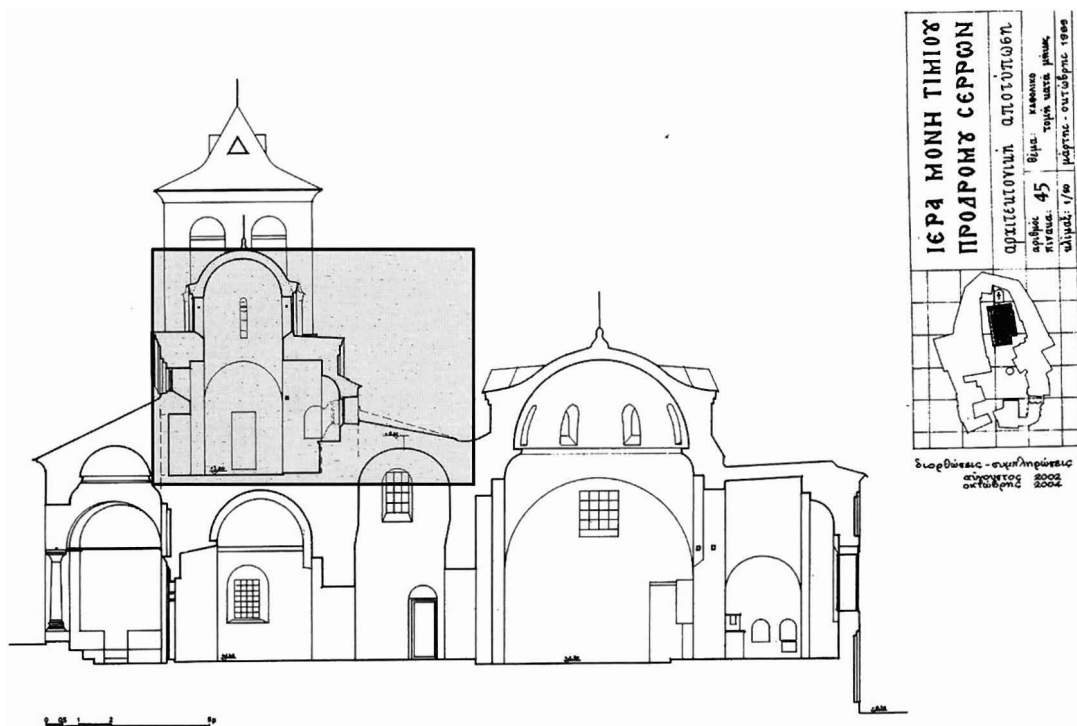
Εικ. 2. Μονή Τιμίου Προδρόμου Σερρών. Καθολικό. Τομή κατά μήκος (αποτύπωση-σχέδιο Παντελής Ξύδας).

στους συγκεκριμένους χώρους ήταν ο δεύτερος κτίτορας της μονής Ιωακείμ - Ιωάννης 6 και ότι τμήμα των διαμερισμάτων του κτίτορα, μαζί με το ιδιωτικό του παρεκκλήσι και το κελλί του, ήταν και η αρχική βιβλιοθήκη της μονής Προδρόμου.