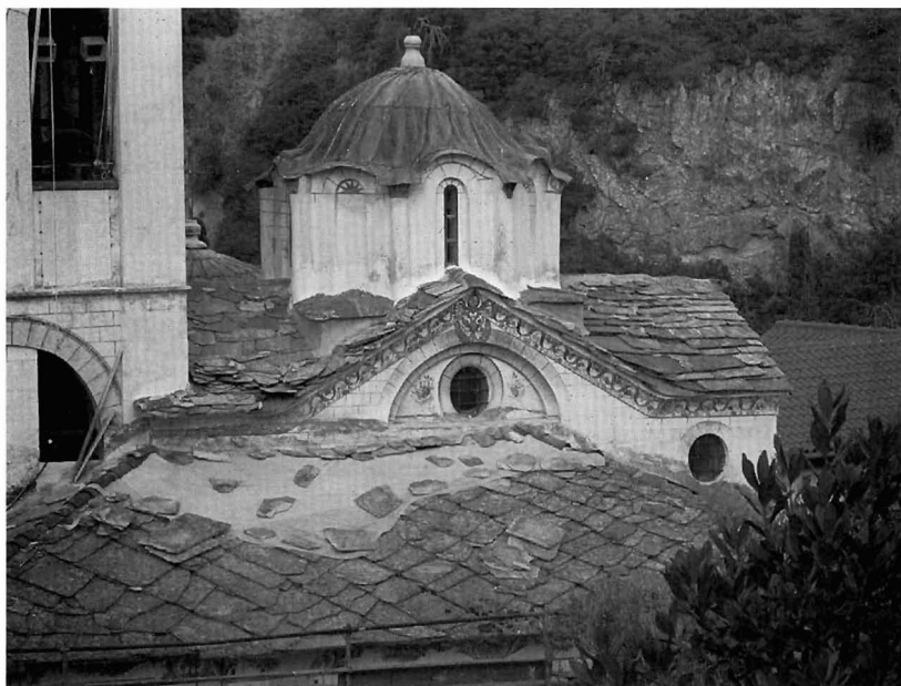
Εικ. 3. Μονή Τιμίου Προδρόμου Σερρών. Καθολικό. Παρεκκλήσι Αγίου Νικολάου. Δυτική πρόσοψη.

Ευαγγελισμού (μεταγενέστερα της Κοιμήσεως της Θεοτόκου) στη Gračanica που κτίστηκε το 1321, και η εκκλησία της Bogorodica Ljeviška με χρονολόγηση περίπου το 1306–1307 στο Κοσσυφοπέδιο 16 .