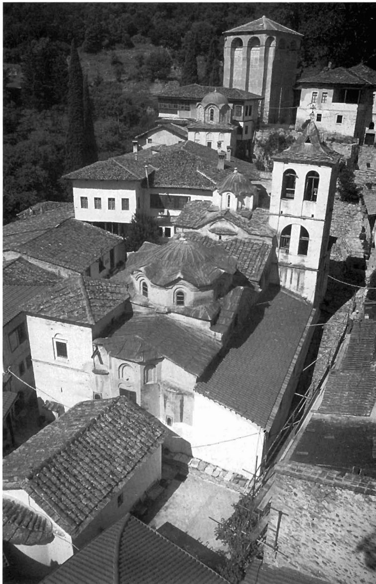
Εικ. 1. Μονή Τιμίου Προδρόμου Σερρών, Καθολικό. Γενική άποψη.

ναού και των προσκισμάτων του ήταν ποικίλες, καθημερινές, και δεν εξυπηρετούσαν μόνο τις θρησκευτικές ανάγκες της κοινότητας 4 . Ειδικότερα, θεωρώ ότι κατά την υστεροβυζαντινή και τουλάχιστον μέχρι και την πρώιμη μεταβυζαντινή περίοδο, ο καθολικός ναός της μονής Προδρόμου φιλοξενούσε εξέχοντα μέλη της μοναστικής κοινότητας 5 . Συγκεκριμένα, στον όροφο του δυτικού τμήματος του ναού διατηρούσαν τα κελλιά τους γέροντες της μονής. Πιστεύω μάλιστα, ότι ο πρώτος γέροντας που διέμεινε