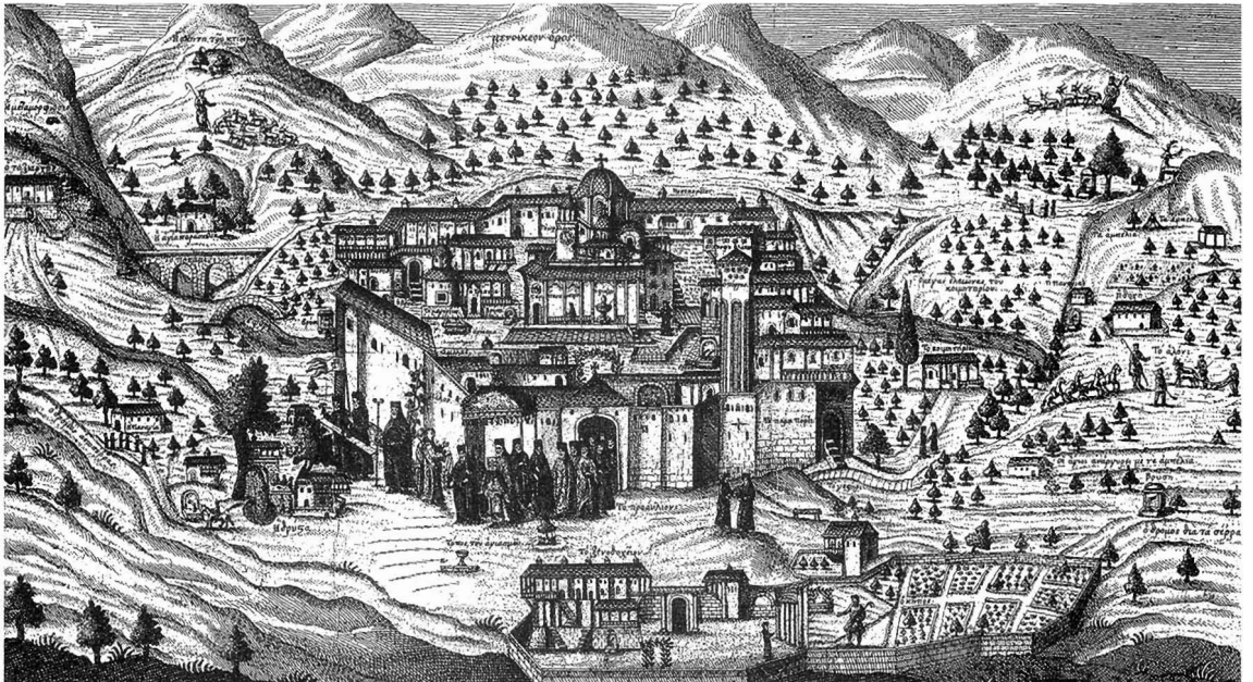
Εικ. 7. Μονή Τιμίου Προδρόμου Σερρών. Λεπτομέρεια χαλκογραφίας. Βιέννη 1761.