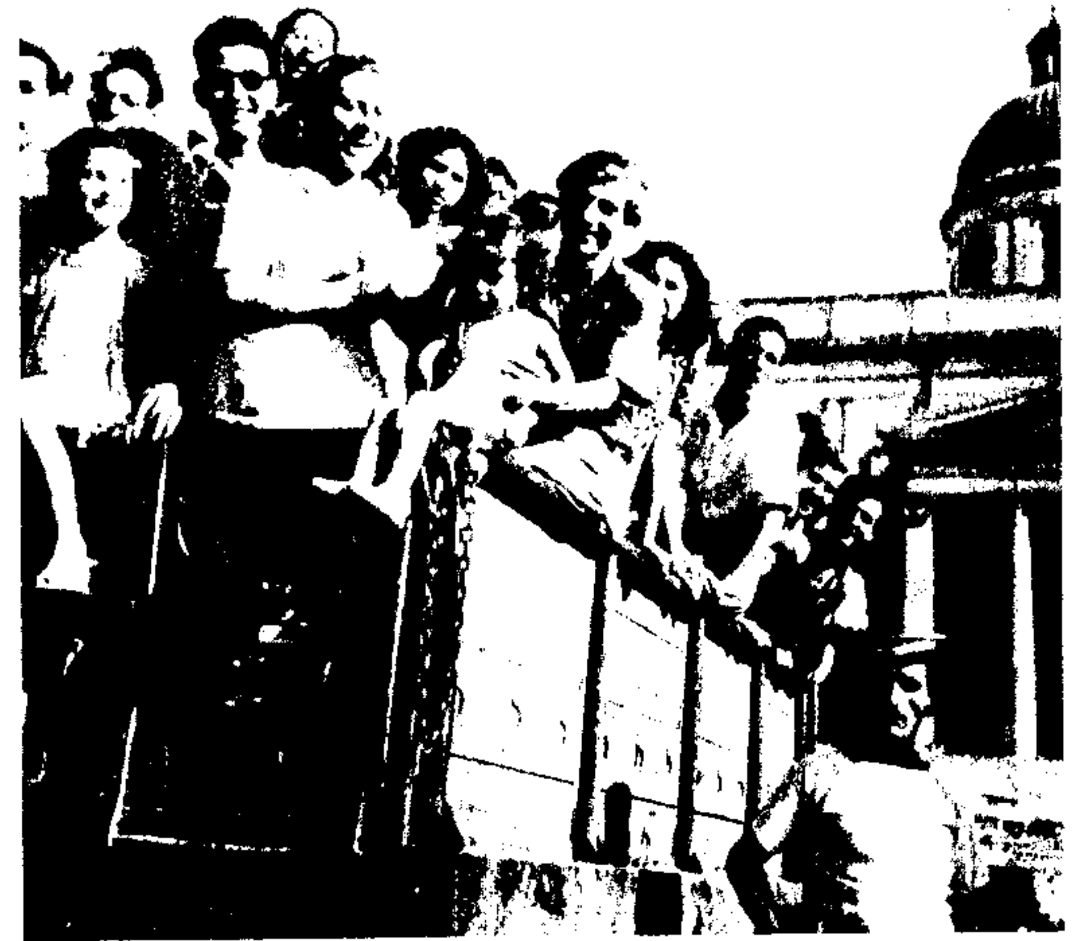
Εικ. 13. Εβραίοι που είχαν βρει καταφύγιο σε χριστιανικά σπίτια, συγκεντρώνονται μετά τον πόλεμο από φιλανθρωπικές οργανώσεις, 1945-46, Ελλάδα.

Για όσους είχαν επιβιώσει από τα στρατόπεδα, ένας ακόμα λόγος αποξένωσης ήταν η φρίκη με την οποία τους αντιμετώπισαν όσοι είχαν περάσει τον πόλεμο κρυμμένοι. Τον Μάρτιο του 1945, ο Λεόν Μπατής, ένας αθηναίος, επέστρεψε στην Ελλάδα. Ήταν ο πρώτος από τους έλληνες αιχμαλώτους που επέστρεψε· είχε φύγει από το Άουσβιτς τον Δεκέμβριο του 1944 και ταξίδεψε με τα πόδια και με τρένα. Όταν στις 15 Μαρτίου έφτασε στη Θεσσαλονίκη, γρήγορα κυκλοφό-