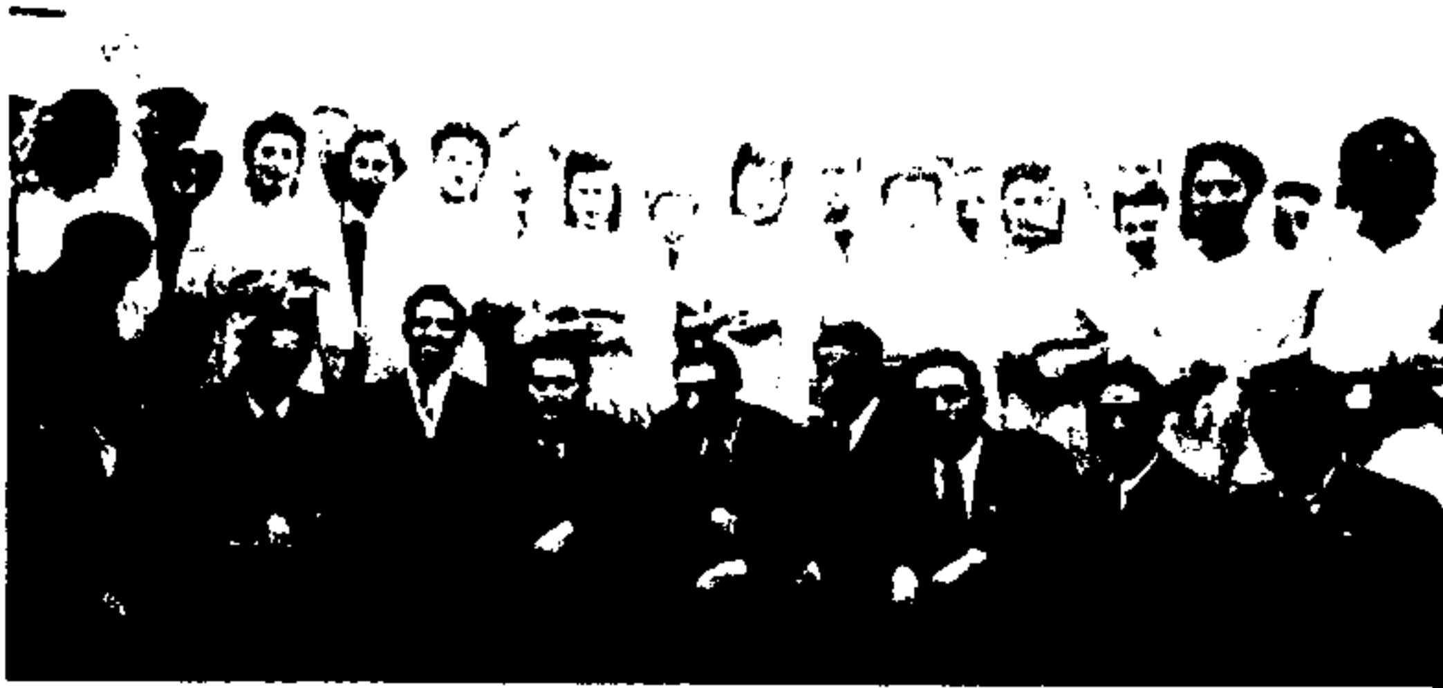
Εικ. 14. Δέκα ζευγάρια παντρεύονται σε σιωνιστική Ακσαρά, Αθήνα, 1946.

ντρεύτηκα πολύ νέα.» 29 Για πολλές γυναίκες, οι δυσκολίες της μοναχικής ζωής με την ταυτόχρονη προσπάθεια διεκδίκησης της περιουσίας τους, την ανασυγκρότηση της παλιάς ζωής και την αποκατάσταση της κανονικότητας, ήταν δυσβάστακτες για να τις αναλάβουν μόνες τους, ιδιαίτερα για όσες δεν είχαν προηγούμενη εμπειρία σε οικονομικά και γραφειοκρατικά ζητήματα. Ο γάμος ήταν ένα σχυρό. Αλλά ενώ πριν τον πόλεμο ήταν ένας θεσμός που συνένωνε την ελληνική εβραϊκή κοινότητα, τη μεταπολεμική περίοδο συνιστούσε έναν ακόμα παράγοντα διάσπασης, καθώς οι γυναίκες, λόγω των δημογραφικών και οικονομικών πιέσεων, παντρεύονταν άντρες από μακρινές πόλεις ή εκτός του ιουδαϊσμού. Πολλές παντρεύτηκαν στα σιωνιστικά Ακσαρά (Hakhshara: σχολεία ή στρατόπεδα εκπαίδευσης για μετανάστες στην Παλαιστίνη, κάποια από τα οποία λειτούργησαν και στην Ελλάδα) εν αναμονή της οριστικής αναχώρησής τους από τη χώρα. Στα Γιάννενα, η συντριπτική πλειοψηφία όσων διασώθηκαν ήταν γυναίκες. Στην Καβάλα, δεν υπήρχαν σχεδόν καθόλου εβραίες. 30 Αλλά ακόμα κι αν οι γυναίκες έβρισκαν σύζυγο, συνήθως δεν είχαν καθόλου χρήματα για προίκα – «και στην Ελλάδα απλά δεν παντρεύεσαι αν δεν έχεις προίκα». 31