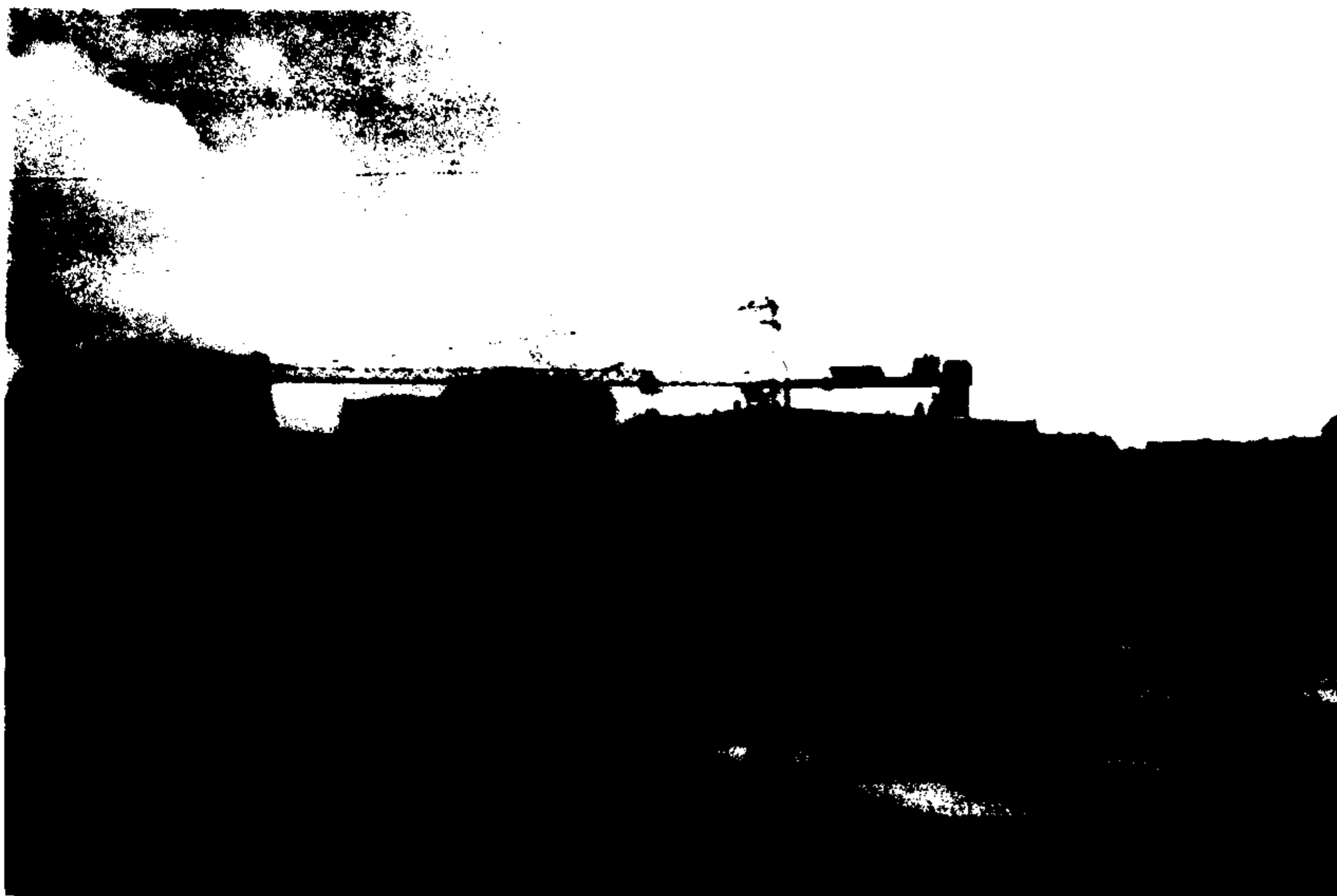
Άποψη του μνημείου των δολοφονημένων Εβραίων της Ευρώπης στο Βερολίνο (Οκτώβριος 2004).

νη είσοδος και έξοδος από το μνημείο. Η αρχιτεκτονική σύλληψη στοχεύει στην ενθάρρυνση της ατομικής προσέγγισης, την ελεύθερη χάραξη της προσωπικής διαδρομής του κάθε επισκέπτη, στοιχείο που υποβοηθά τον αναστοχασμό και την υποκειμενική ερμηνεία του μνημείου. Στο έδαφος δημιουργούνται ελαφριές κλίσεις που δίνουν την εντύπωση κυματισμού και διαφοροποιούν τη διαδρομή του κάθε επισκέπτη αναλόγως του σημείου από το οποίο θα εισέλθει στον μνημονικό τόπο και της πορείας που θα ακολουθήσει. Η σύλληψη του μνημείου ακολουθεί τη σύγχρονη «αντι-ηρωική» λογική που αναιρεί τη βεβαιότητα της συμπαγούς «συλλογικής μνήμης» και προβάλλει την υποκειμενικότητα της «συλλεγμένης μνήμης», μία διεργασία που απαιτεί την προσωπική ενεργοποίηση και κριτική επίσκεψη του παρελθόντος 5 .