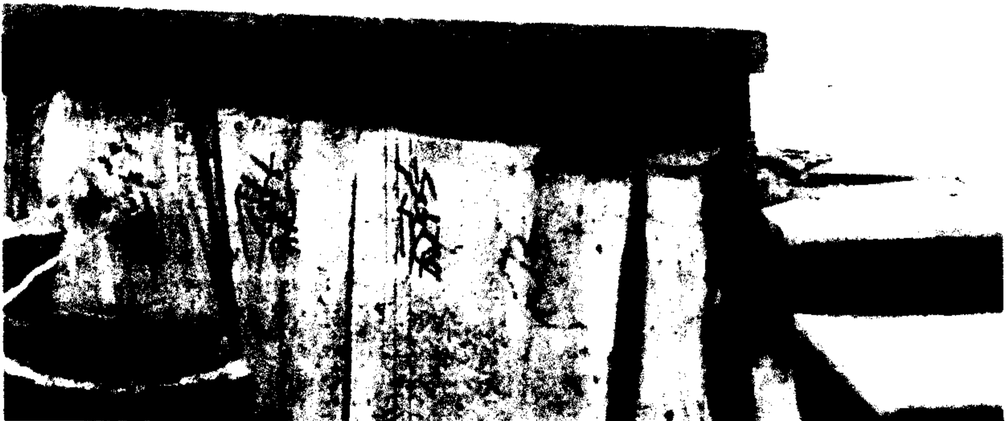
Το μνημείο Εβραίων μαρτύρων στη Λάρισα.