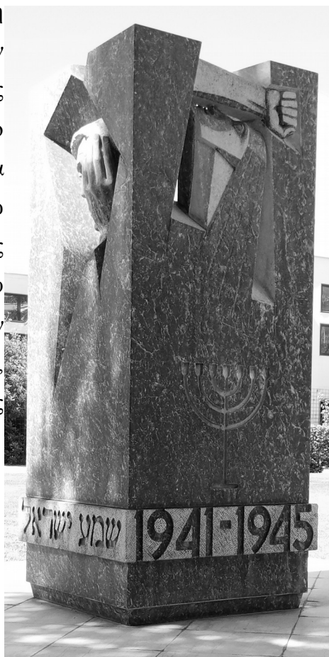
Εικόνα 1: Το μνημείο Ολοκαυτώματος του Βόλου

Η μετάβαση σε μια δημόσια επιτέλεση «κοινωνικής μνημόνευσης», κατά τον Jay Winter 28 , στην Ελλάδα αρχίζει στα τέλη της δεκαετίας του '80 με την «έκθεση» στο δημόσιο χώρο των πρώτων μνημείων – ηρώων 29 . Στα μνημεία – ηρώα που τοποθετούνται, μέσω συνεργασίας με τους δήμους οι αναφορές αφορούν το σύνολο των θυμάτων του Ολοκαυτώματος με την αναγραφή στοιχείων των εβραϊκών κοινοτήτων στα εβραϊκά και ελληνικά, με αναπαραστάσεις μορφών ή αφαιρετικές συνθέσεις.