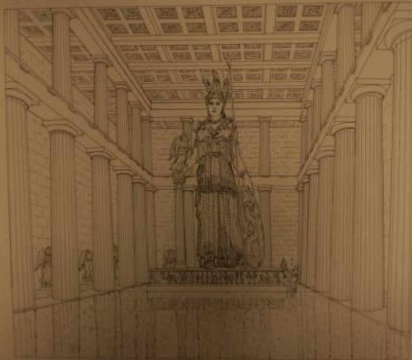
101. Reconstruction of the Parthenon's interior with statue of Athena Parthenos.

Η χρυσελεφάντινη Αθηνά Παρθένος, έργο του Φειδία, μέσα στον σηκό του περικόλειου Παρθενώνος. 438 π.Χ. Γραφική αναπαράσταση.