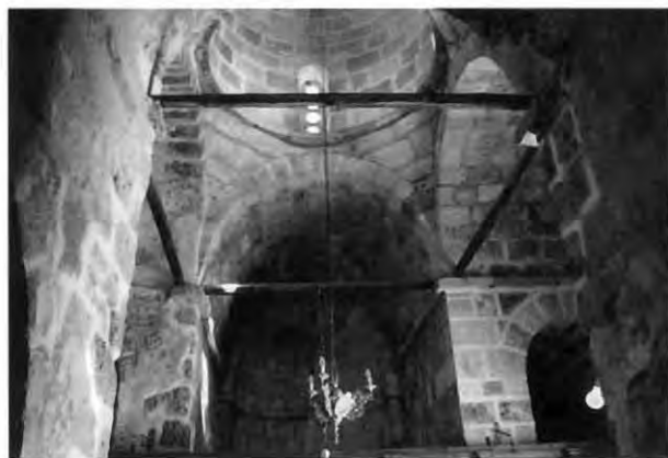
Εικ. 4: Άγιος Γεώργιος Χορτακίων. Εσωτερική άποψη προς το ιερό βήμα.

Μοναδικό αυθεντικό παράθυρο στον νάρθηκα θα μπορούσε να θεωρηθεί το μονόλοβο και σχετικά ψηλό άνοιγμα της βόρειας πλευράς, το οποίο φέρει μονολιθικό υπέρθυρο με μέτωπο τόξου σε μικρή υποχώρηση (εικ. 5). Επισημαίνεται, ωστόσο, ότι το πάνω τμήμα ενδέχεται να υπερυψώθηκε, σε μεταγενέστερη περίοδο 14 . Ανάλογων διαστάσεων και μορφής ήταν