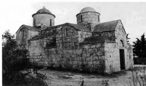
Εικ. 5: Άγιος Γεώργιος Χορτακίων. Βορειοδυτική άποψη.