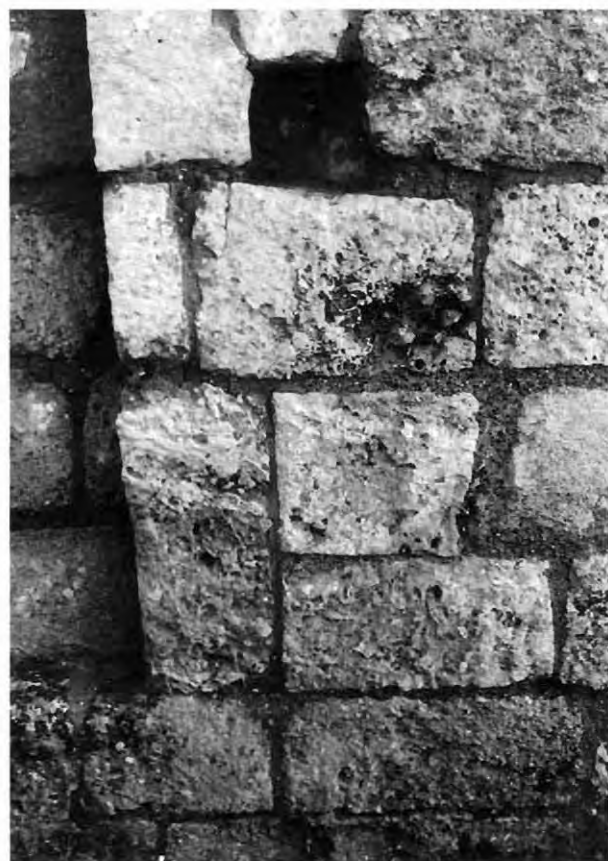
Εικ. 6: Άγιος Γεώργιος Χορτακίων. Λεπτομέρεια δεξιάς παρειάς βόρειου αφιδώματος.