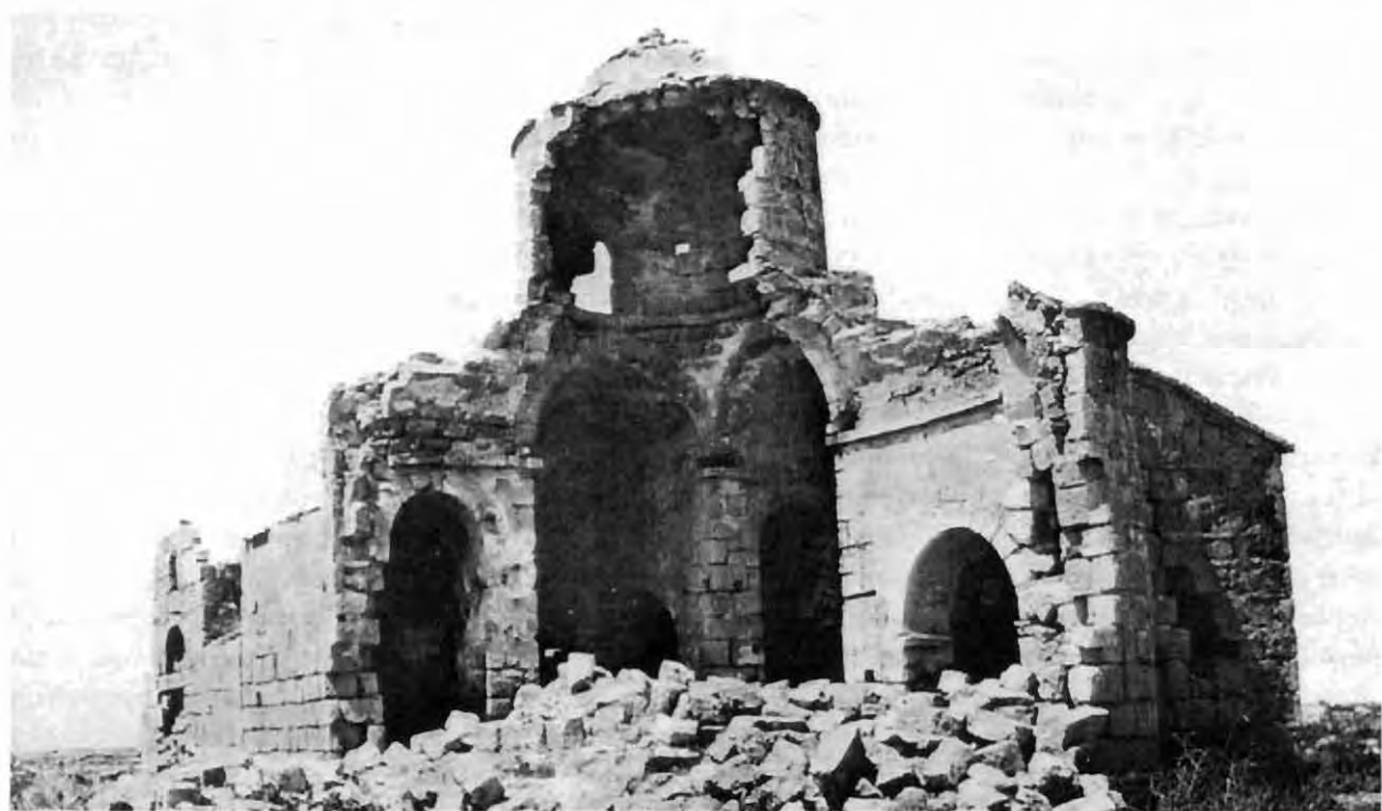
Εικ. 1: Άγιος Γεώργιος Χορτακίων. Νοτιοανατολική άποψη (φωτ. Γ. Σωτηρίου, 1931).

Μοναδικό αδιατάρακτο παράθυρο της αρχικής φάσης αποτελεί το μονόλοβο άνοιγμα που υπάρχει στο πάνω μέρος του τυμπάνου του βόρειου σκέλους (εικ. 5). Η μορφή του αντίστοιχου παράθυρου στη νότια πλευρά δεν είναι γνωστή. Ενδέχεται να ήταν και εκείνο μονόλοβο, όπως αποκαταστάθηκε κατά την ανακατασκευή ολόκληρου του νοτιοανατολικού τμήματος του ναού (εικ. 2). Ανακατασκευασμένο είναι και το μονόλοβο παράθυρο της ημικυλινδρικής αφίδας του ιερού, η αρχική μορφή του οποίου παραμένει άγνωστη. Η βόρεια παρειά ενός ανοίγματος που διακρίνεται σε φωτογραφία αρχείου θα μπορούσε να αποτελεί το υπόλειμμα ενός μονόλοβου ή και δίλοβου παράθυρου (εικ. 1). Από την ίδια φωτογραφική λήψη, που έγινε