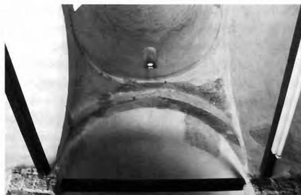
Εικ. 8: Άγιος Γεώργιος Χορτακιών. Λεπτομέρεια ανωδομής στον τρουλαίο χώρο του νάρθηκα.