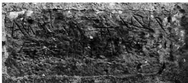
Εικ. 13: Άγιος Γεώργιος Χορτακιών. Χαρακτή επιγραφή στο ακραίο ανατολικό τμήμα της βόρειας πλευράς.

Η χρονολόγηση του νάρθηκα είναι ακόμα δυσκολότερη, επειδή πρόκειται, σύμφωνα με τα παραπάνω, για μια προσθήκη ποικίλων δεσμεύσεων. Τα κατασκευαστικά στοιχεία που διαφέρουν σαφώς από εκείνα του αρχικού ναού είναι οι φαρδείς αρμοί στις εσωτερικές επιφάνειες των τοίχων, η περιορισμένη χρήση διαμπερών οριζόντιων αρμών στις στρώσεις της τοιχοποιίας, η ελλειψοειδής μορφή των τόξων και των ημικυλινδρικών καμαρών, καθώς και η χρήση