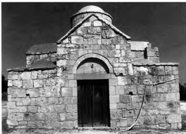
Εικ. 10: Άγιος Γεώργιος Χορτακίων. Δυτική πλευρά.

Ο αρχικός πυρήνας του Αγίου Γεωργίου Χορτακίων θα πρέπει να παρέμεινε για αρκετές δεκαετίες χωρίς νάρθηκα, όπως συνέβη και με άλλους ναούς του ίδιου τύπου στην Κύπρο 20 , με χαρακτηριστικά παραδείγματα τον Άγιο Φίλιωνα στο Ριζοκάρπασο 21 και τον αρχικό ναό του Αγίου Ιωάννη του Λαμπαδιστή στο χωριό Καλοπαναγιώτης 22 . Σύμφωνα με τις πρώτες εκτιμήσεις, εάν θέλαμε να εκφράσουμε μια προκαταρκτική άποψη για τη χρονική ακολουθία των τριών αυτών μνημείων, θα τοποθετούσαμε τον Άγιο