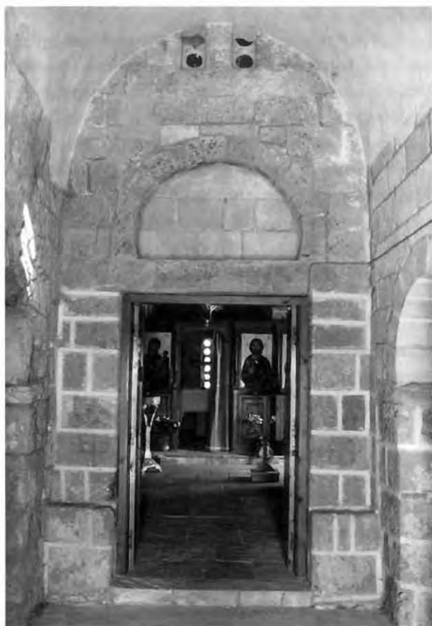
Εικ. 7: Άγιος Γεώργιος Χορτακιών. Δυτική είσοδος κυρίως ναού.