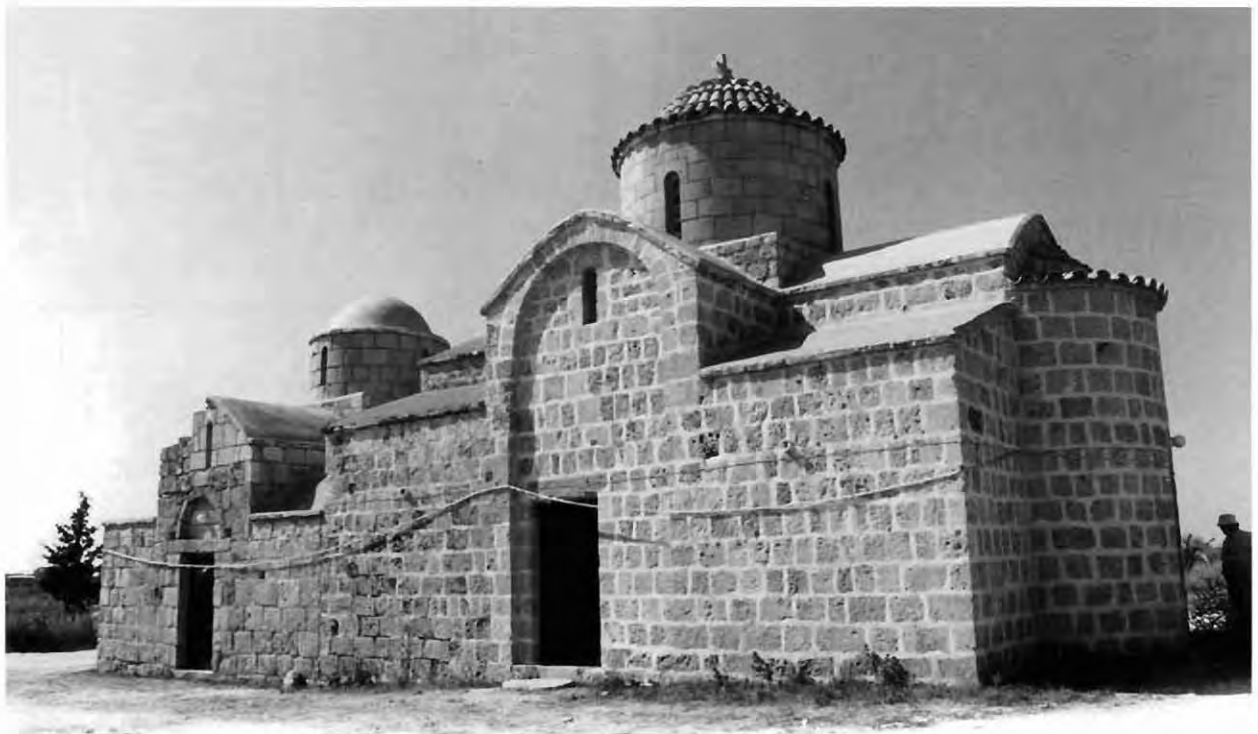
Εικ. 2: Άγιος Γεώργιος Χορτακίων. Νοτιοανατολική άποψη.

Ο επικεφαλής του οικοδομικού συνεργείου που έκτισε τον ισοπλατή με τον αρχικό ναό νάρθηκα, έχοντας επιλέξει τον τύπο και το μέγεθος της προσθήκης, έλαβε υπόψη δύο βασικές παραμέτρους: την κλίμακα του νέου έργου και τον τρόπο προσαρμογής του στο προυπάρχον κτίριο. Σεβόμενος την ποιότητα οργάνωσης του δυτικού τυμπάνου τού κυρίως ναού, το-