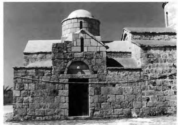
Εικ. 11: Άγιος Γεώργιος Χορτακίων. Νότια πλευρά του νάρθηκα.