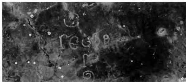
Εικ. 14: Άγιος Γεώργιος Χορτακιών. Ενεπίγραφο τμήμα από τα σωζόμενα σπαράγματα των τοιχογραφιών στον βόρειο τοίχο του νάρθηκα.