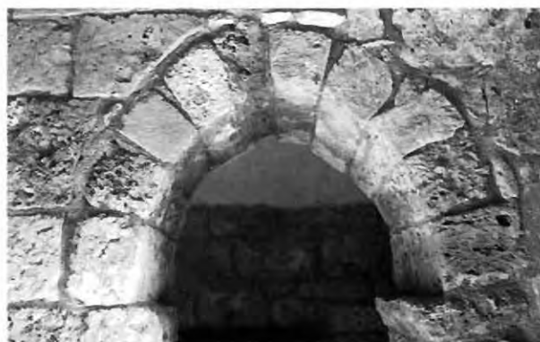
Εικ. 9: Άγιος Γεώργιος Χορτακιών. Τόξο νοτιοδυτικού διαμερίσματος νάρθηκα.

και το ανακατασκευασμένο παράθυρο της νότιας πλευράς, η μορφή του οποίου είναι γνωστή από φωτογραφίες αρχείου (εικ. 1) 15 .