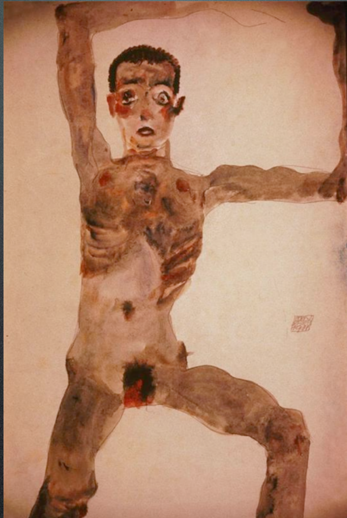
Egon Schiele, "Boy"