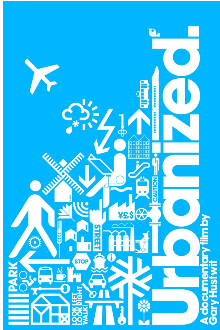
Urbanized (2011), documentary (1h 25min), by Gary Hustwit https://www.youtube.com/watch?v=HOG3ONjRS3o