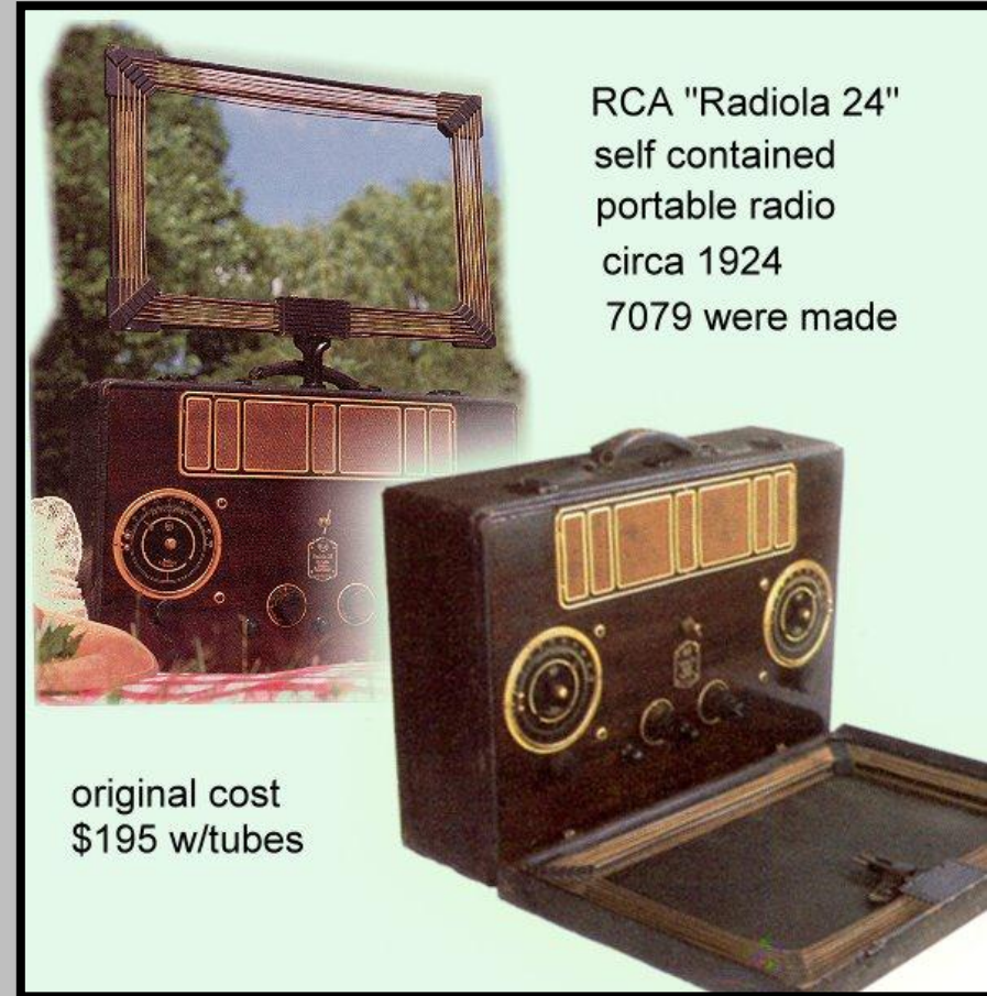
RCA "Radiola 24" self contained portable radio circa 1924 7079 were made