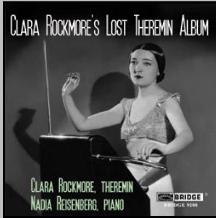
Therminovox, RCA, 1929