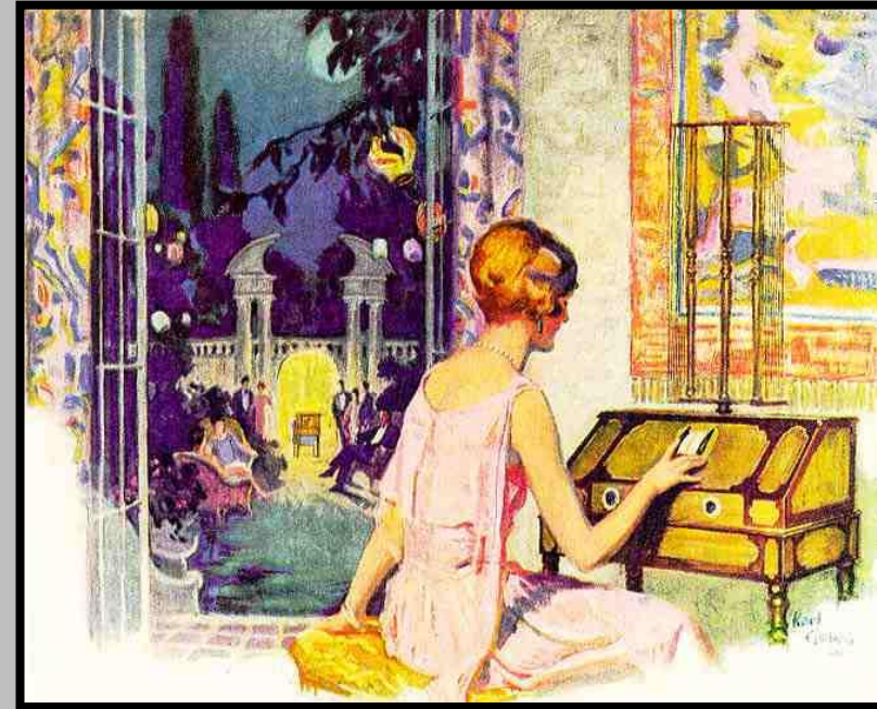
Διαφήμιση της Radiola , δεκαετία '20