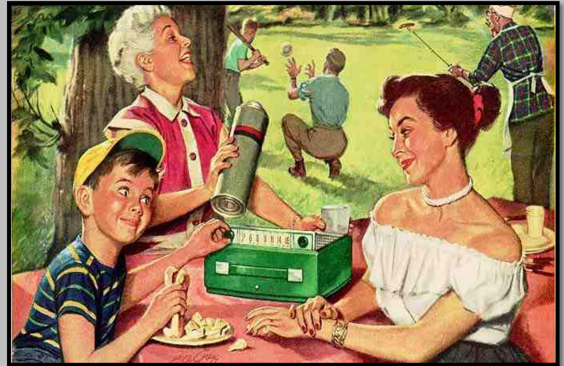
Life , 1950