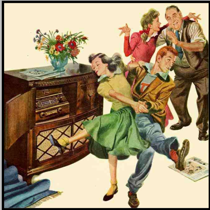
Life , 1940