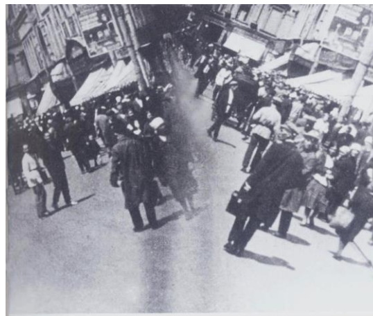
«Ο άνθρωπος με την κινηματογραφική μηχανή», Τζίγκα Βερτώφ, 1929

Η μητρόπολη όραμα οικοδόμησης του μέλλοντος