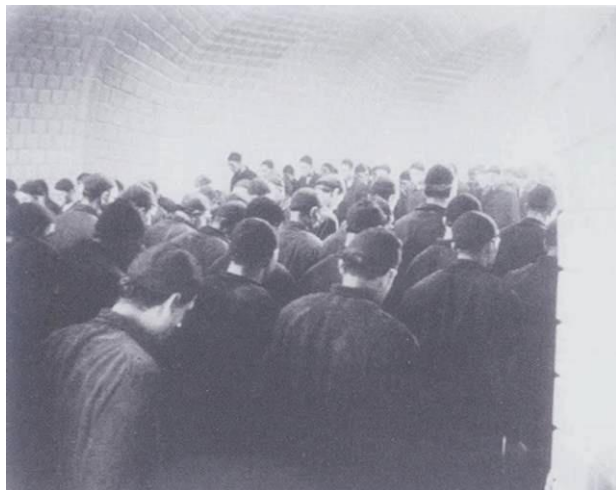
Αριστερά: «Μητρόπολη», Φριτς Λανγκ (1926)