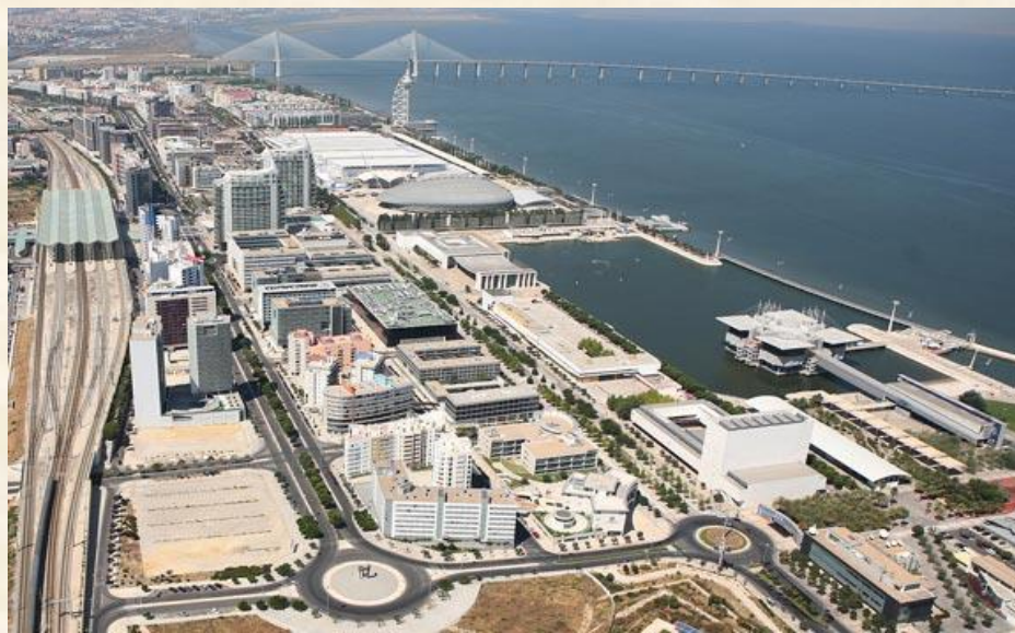
1998 World Expo site; Η γιγαντιαία έκταση

Οι εγκαταστάσεις στερήθηκαν δραστηριότητας μετά το Γεγονός.