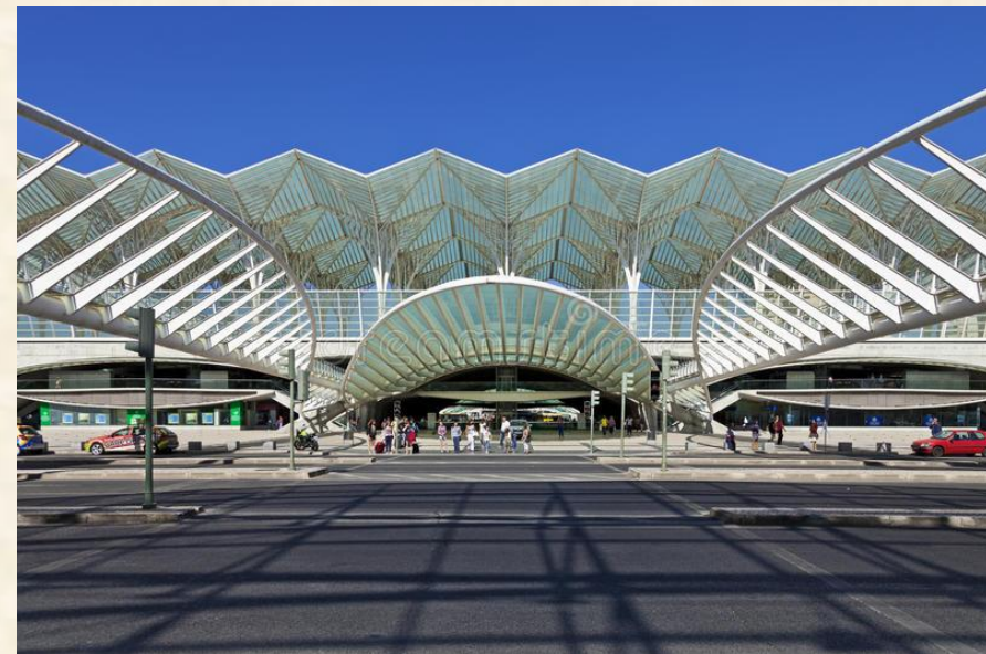
Orient station , σχεδιασμένο από τον Calatrava