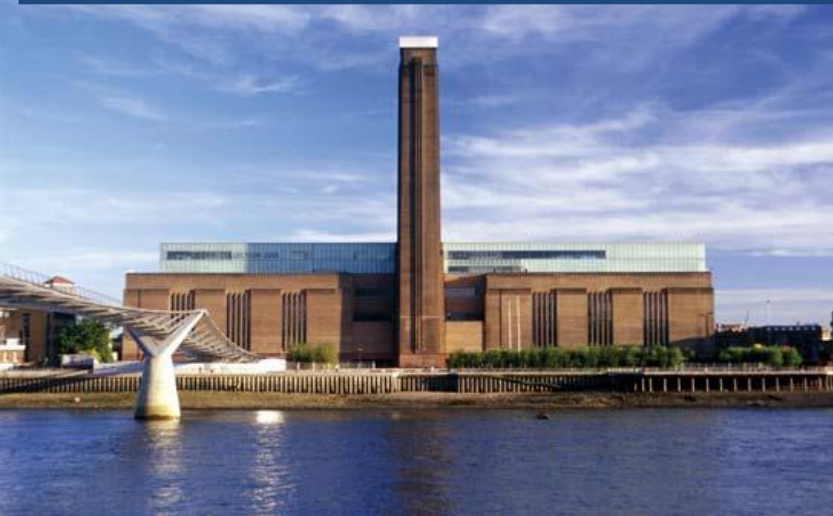
Tate Modern Gallery, a former Bankside electricity Power Station built in 1947