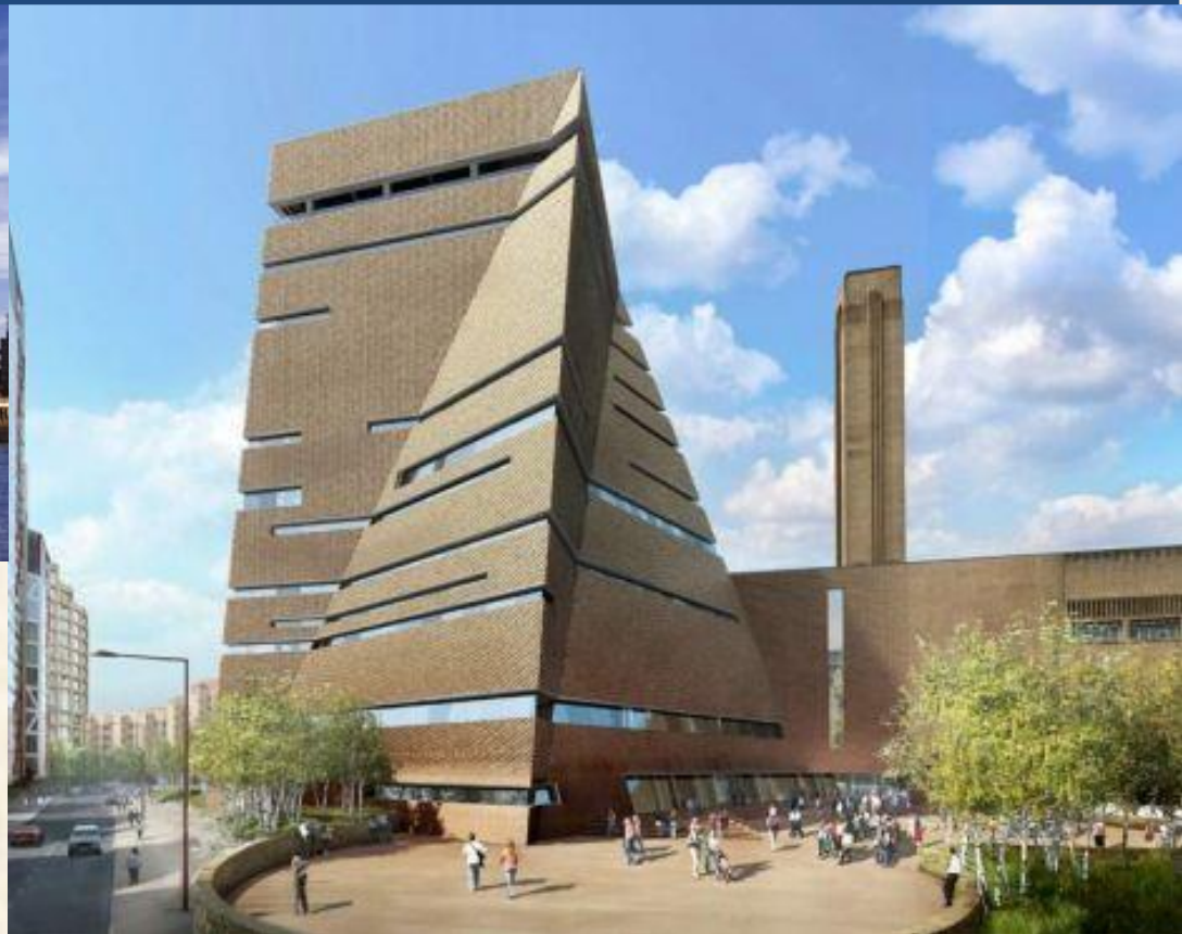
The extension of Tate Modern building designed by Herzog & de Meuron architects, awarded the New London Architecture Award (2011)