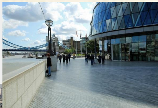
In front of London City Hall.