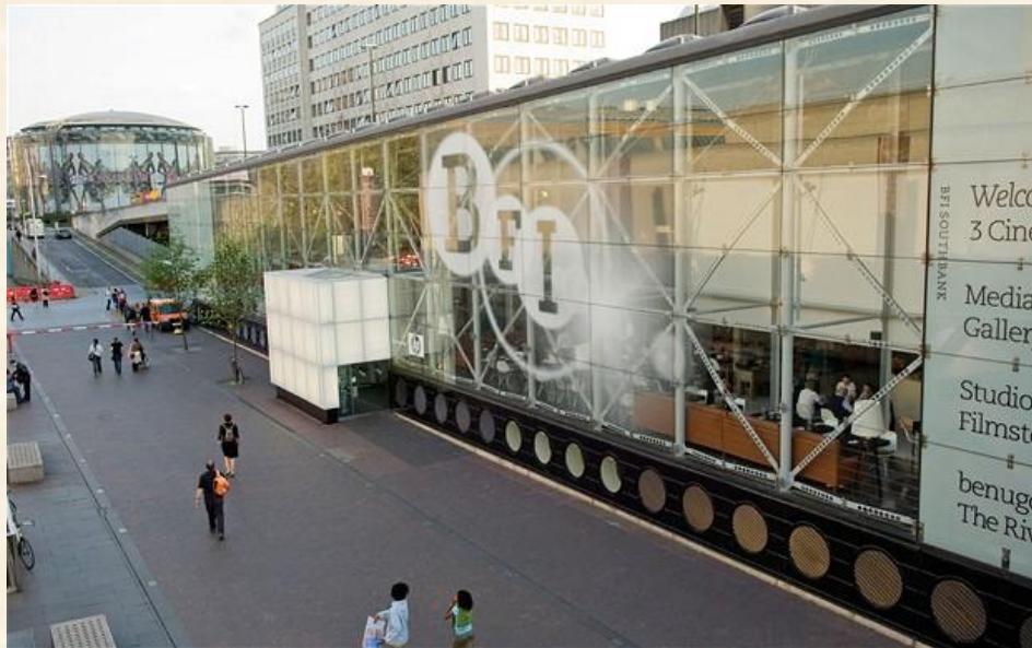
BFI - British Film and television Industry