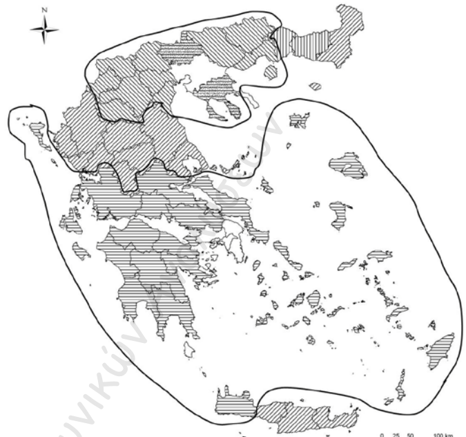
Χάρτης 2: Οι κατευθύνσεις των μεταναστευτικών ρευμάτων