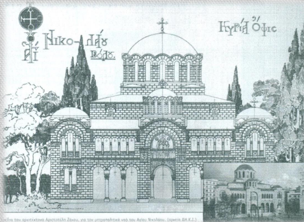
Σχέδιο του αρχιτέκτονα Αριστοτέλη Ζάχου, για τον μητροπολιτικό ναό του Αγίου Νικολάου.