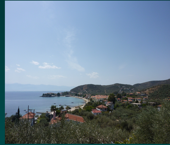
Χρυσή Ακτή Παναγίας