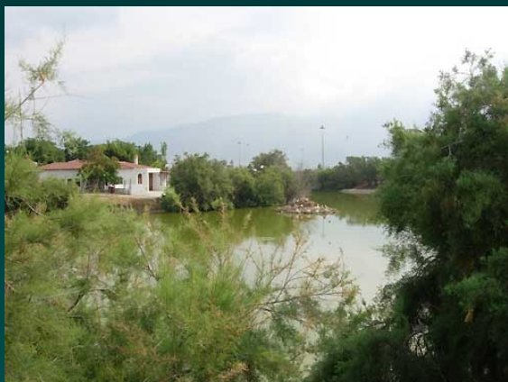
Πεδ.Αρεως, εκβολή Ξηριά