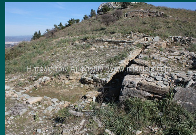
Σωρός: αρχ. Αμφάνες