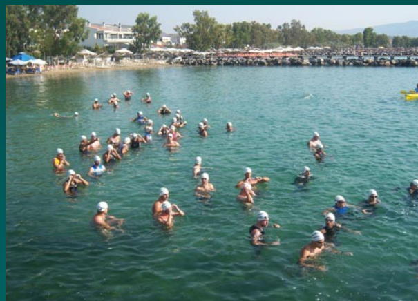
Αλυκές, παραλία (οργ.)