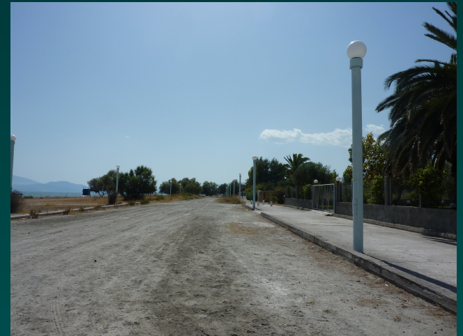
Δημητριάδα Ν. Αγχιάλου