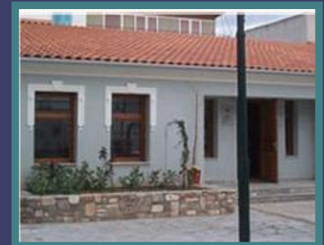
Κέντρο Προσφύγων, Προσφυγικά, Βόλος