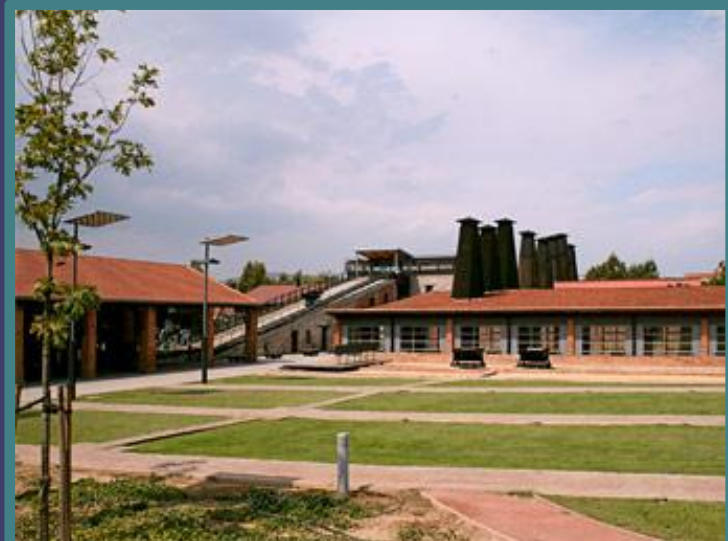
Συγκρότημα Τσαλαπάτα πριν και μετά το Πρόγραμμα URBAN I