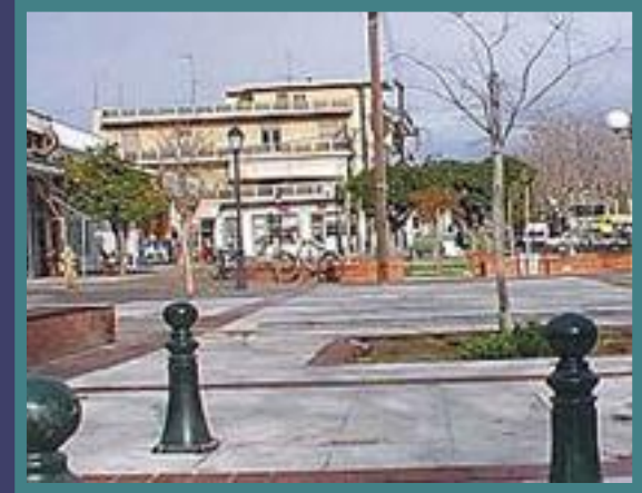
Πλατεία Συντριβανίου, Παλαιά, Βόλος

Ανάπλαση Πλατείας, Πεζοδρομήσεις, Κεντρικός Χώρος Αναφοράς στην Περιοχή, Πλατεία Εισόδου στην Ιστορική Περιοχή του Λόφου των Παλαιών