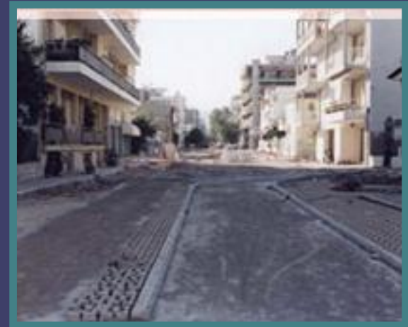
Τμήμα Οδού Ρ.Φεραίου κατά τη διάρκεια των παρεμβάσεων

Πεζοδρόμηση, Δημιουργία Πεζοποδηλατόδρομου, Διαμόρφωση Χώρων Συνάντησης και Αναψυχής, Ενίσχυση Πρασίνου, Κεντρικός Χώρος Αναφοράς στην Περιοχή, Σύνδεση Επιμέρους Παρεμβάσεων