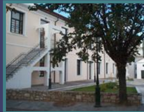
Μεταξουργείο πριν και μετά το Πρόγραμμα URBAN I