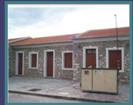
Παιδικός Σταθμός, Προσφυγικά, Βόλος

Παρόμοια Διαδικασία με το Κέντρο Αδύνατων Ομάδων (Ιδιοκτησιακά-Φυσική Κατάσταση-Παρέμβαση) Υποστήριξη Ειδικών Κοινωνικών Ομάδων- Παλινοστούντες Πρόσφυγες